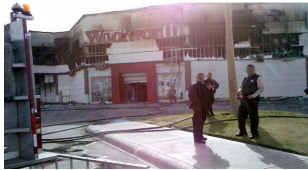
Acción de la CCF-FAI/Mexico en Tijuana

Un buen ejemplo es la acción insurrecta llevada a cabo por la Conspiración de las Células de Fuego de México en Ciudad Juárez en donde se incendio el centro comercial Woolworth del centro comercial Las Torres en respuesta por la represión al movimiento de indignados, que aunque no compartían su postura política, expresaban su rechazo total al monopolio de la violencia ejercida por el Estado(4).