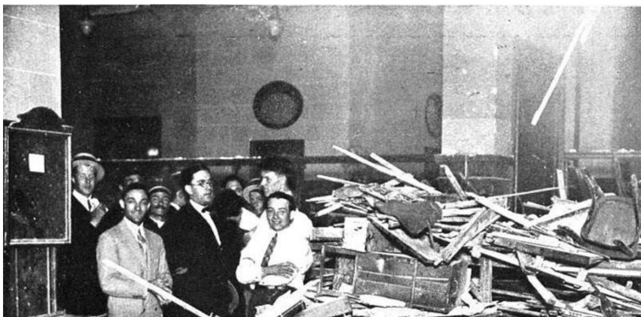
Foto del atentado al City Bank, en Buenos Aires el día 24 de diciembre de 1927

Escrito de Di Giovanni para Renzo Novatore luego de su caída en combate