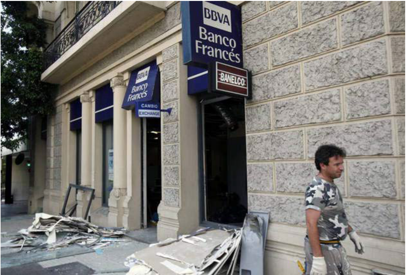
Foto de la entrada del Banco Francés, luego de “la visita” de la Brigada Andrea Salcedo en la madrugada del 4 de agosto de 2010.