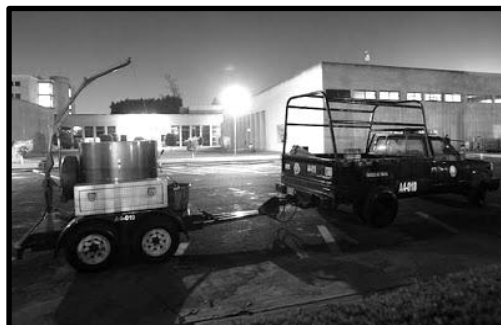
Policía especializada en explosivos del D.F., retirando un paquete bomba del Instituto Nacional de Psiquiatría en 2011. Acto reivindicado por el grupo “NS-Fera-Kamala y Amala”