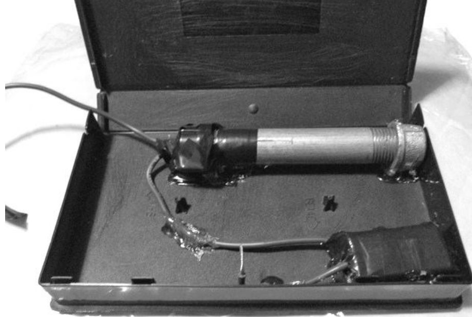
Paquete bomba enviado a rector de la UNAM