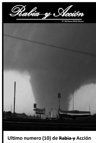
Ultimo numero (10) de Rabia y Acción

terroristas que se posicionan en contra del sistema tecno-industrial, y a favor de la naturaleza salvaje en México, (el primer surgimiento se dio en 2011, con las “ Individualidades Tendiendo a lo Salvaje ”, las “ Células Terroristas por el Ataque Directo – Fracción Anticivilizadora ” y “ NS-Fera-Kamala y Amala ”, en 2013 surgió el “ Proyecto Musical: Mundo Muerto ”, que aunque no es un grupo terrorista, lo mencionamos por estar de acuerdo con muchos de sus puntos expuestos en su demo), hoy han salido a la luz pública el “ Círculo de Ataque – Punta de Obsidiana ”, el “ Grupo Atlatl ”, la revista “ Regresión ”,