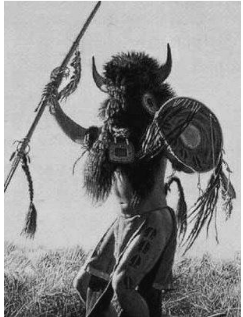
Conjunto de textos contra el progreso tecnológico (quinta parte)