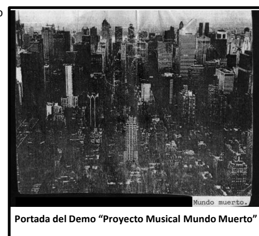
Portada del Demo "Proyecto Musical Mundo Muerto"