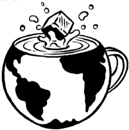
#gravitationswellen von Benedikt Rugar