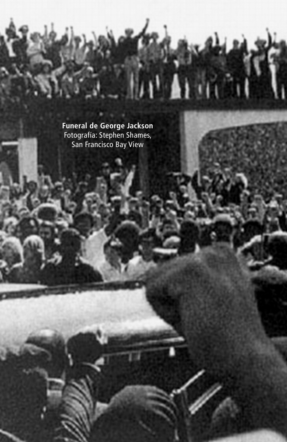
Funeral de George Jackson