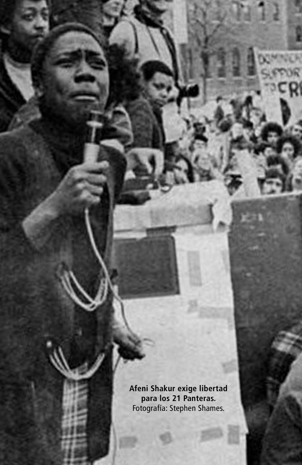
Afeni Shakur exige libertad para los 21 Panteras.