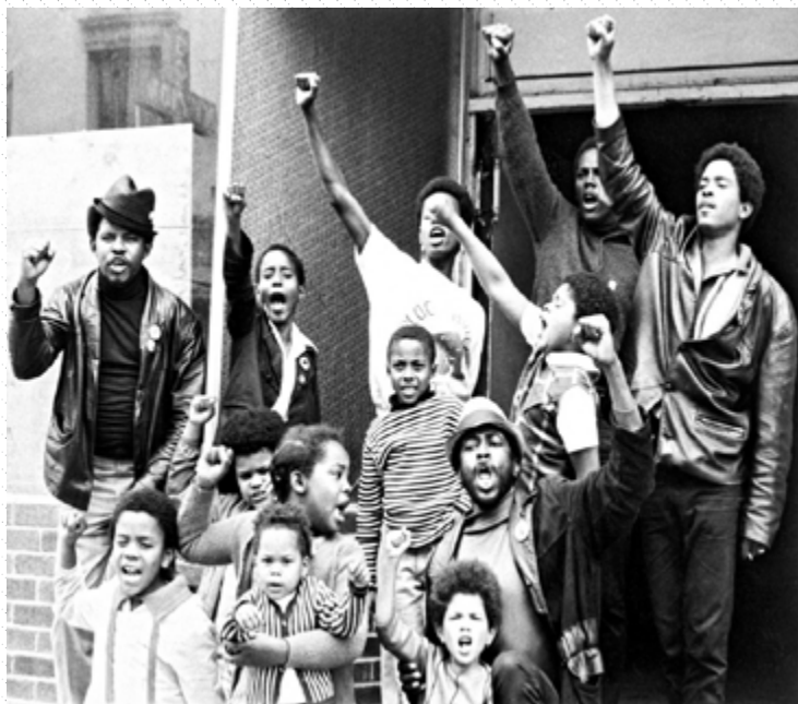
Black Panther Liberation School

—Punto número cinco del Programa de diez puntos del Partido Pantera Negra