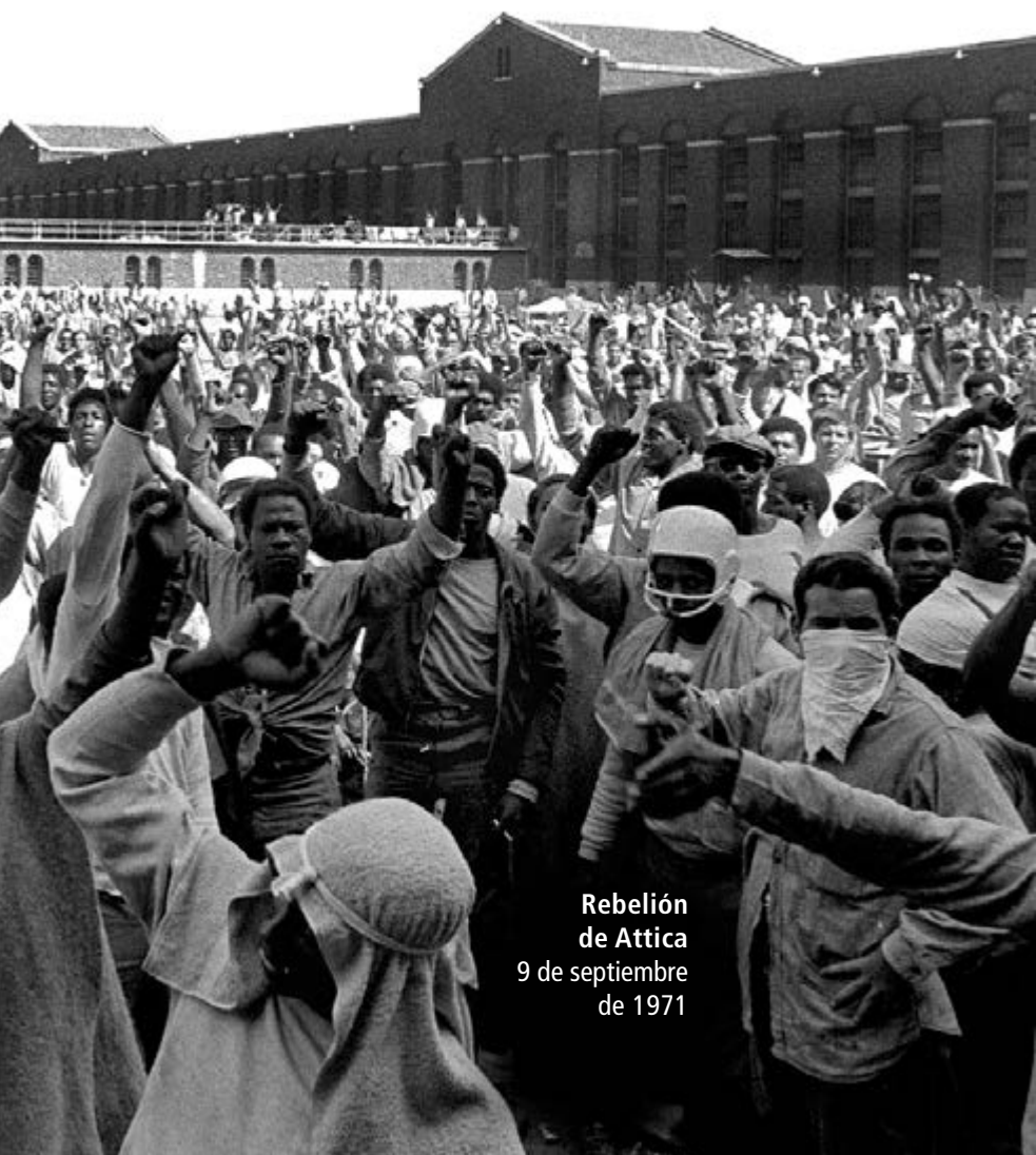
Rebelión de Attica 9 de septiembre de 1971