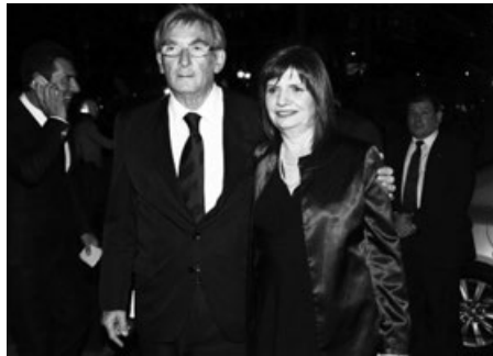
Bullrich militante del PJ; ministra de Trabajo de De la Rúa; con Cavallo en sus tiempos de secretaria de Política de Seguridad; y con su pareja, hoy.

te se trata de delito transnacional y todos los Estados tienen que trabajar en un ámbito de cooperación para combatirlos. Pero decir que nosotros vamos a resolver los problemas porque hemos establecido fuertes vínculos, convenios o acciones conjuntas con estos organismos y que con eso estamos combatiendo el fenómeno interno, es mentira. Porque no funciona así. Y me remito a los hechos: cada vez hay más chicos que están en la droga, incorporados ya como factores económicos del fenómeno. Entonces la receta no puede ser militar ni policial: es una receta social. Y hablo de praxis pura en esto, no estoy