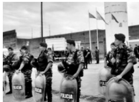
Política en acción: las detenciones del 8M, la comunidad mapuche baleada, los integrantes de La Garganta Poderosa amenazados y los trabajadores de Petinari desalojados.

"La alianza con sectores conservadores de Israel, sectores financieros, aliados a Estados Unidos, los fondos buitres, sectores militares conservadores norteamericanos, así como antes Argentina se alineaba con países de Mercosur. Eso en seguridad influye mucho".