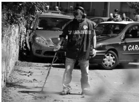
Výšetřování v místě střelby

touto akcí (V prosinci 2011 poslala tato buňka tři dopisní bomby v Německu, Francii a Itálii. Dvě byly zneškodněny, jedna ale vybuchla v rukách výkonného ředitele Equitalia, poranila ho a téměř oslepila. - pozn. překl.) ukázali, že konzistence a soudržnost se vyplatí a že není nutné limitovat se na jednání pro dosažení „konsenzu“. Tito soudruzi setřásli z našich zad kletbu, kterou anarchisté nesli dlouhou dobu, kletbu tohoto špatně interpretovaného vyhledávání sociálního konsenzu, který svazuje ruce těm, kdo si uvědomují nutnost jednat tady a teď.