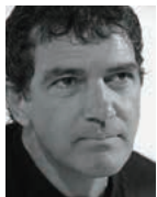
アントニオ・バンデラス (スペイン)

国際的な人気を博すスペインのシェフ、ジョアン・ロカ、ジョセップ・ロカ、ジョルディ・ロカの3兄弟。定評あるレストラン「エル・セジェール・デ・カン・ロカ」のオーナーを務め、レストラン・マガジン誌から2度にわたり「世界のベストレストラン」に選ばれました。2016年1月に親善大使に就任。