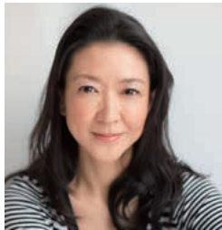
紺野美沙子 (日本) Misako Konno

国連開発計画(UNDP)は、日本の俳優・紺野美沙子氏をはじめ、グローバルな親善大使を任命しています。親善大使は、世界各地でUNDPや開発課題のアドボカシー活動に協力しています。UNDPの親善大使が中心となり始まったサッカー・チャリティー試合「貧困との闘い(Match Against Poverty)」はこれまでに全世界で計11回開催されています。