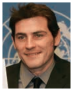
イケル・カシージャス (スペイン)

HBOのテレビドラマシリーズ「ゲーム・オブ・スローンズ」で世界的に有名な俳優。特にジェンダー平等と気候変動による影響の軽減を中心に、SDGsを支援。2016年9月に親善大使に就任。