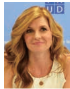
コニー・ブリットン (アメリカ)

Crown Prince Haakon Magnus of Norway ノルウェー王国王太子。UNDP親善大使として数多くの途上国を公式訪問し、近年ではハイチやネパールなどを訪れました。人間開発報告書書の業務にも貢献し、2007/08年の人間開発報告書の諮問パネル、2007年人間開発賞の委員を務めました。2003年10月に就任。