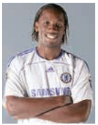
ディディエ・ドログバ (コートジボワール)

米国を代表する女優の1人。エミー賞を4度受賞した経験を持ちます。長年、貧困削減および女性の権利拡大を積極的に支援。2014年4月に親善大使に就任。