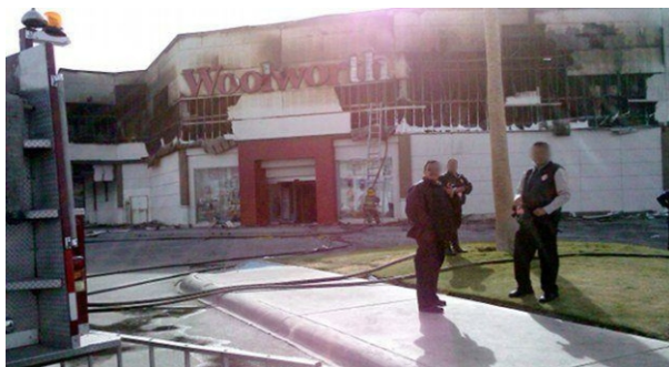
Acción de la CCF-FAI/Mexico en Tijuana

Entonces sería una consecuencia de estar en contra de un sistema que media nuestra existencia. Solidarizarnos con un apresado político (y porque no también con uno común) sería una expresión por la negación de la cárcel en concordancia con la lógica de que “la libertad es contraria al encierro y la limitación”.