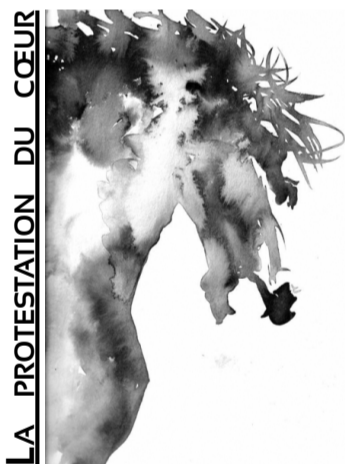
LA PROTESTATION DU CŒUR