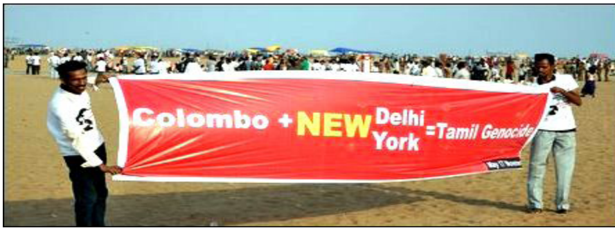
Sri lankas regering, samt den indiska och amerikanska är ansvariga för folkmordet.

Syftet är att ställa dessa tolv inför rätta i en internationell krigsförbrytarens domstol. LTTE's egna grova brott minskar naturligtvis inte regeringens skuld för sina brott.