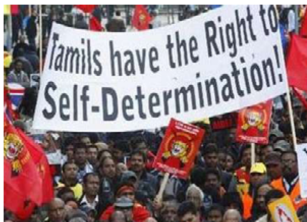
Tamiler i exil demonstrerar

LTTE klassificerad som en terroristorganisation, vilket gör att den inte kan arbeta under namnet LTTE. Dess representanter har därför valt andra namn för sina nya organisationer och dessutom en annan strategi för sin målsättning att vinna Tamililam. Militära medel har förkastats till förmån för politiska medel främst i form av lobbyverksamhet. Det finns tre organisationer, som valt att bli synliga med hög profil och flera andra som valt att hålla en låg profil, men som ändå gör ett viktigt mullvadsarbete. Vad