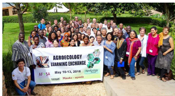
En mai 2016, nous avons participé en Ouganda à une rencontre internationale sur les stratégies de l'agroécologie organisée par l'Alliance pour la souveraineté alimentaire en Afrique et par l'Agroecology Fund.

Il y a plus de 25 ans que GRAIN a commencé à travailler sur la conservation et le contrôle des semences, et cette question est restée un élément central de notre travail. Dans les champs des agriculteurs, la biodiversité se réduit à un rythme alarmant, tandis que les grandes entreprises prennent un pouvoir sans précédent sur les semences. Mais des mouvements sociaux de défense des droits des paysans et des populations autochtones sur les semences émergent partout pour s'opposer à cette évolution. GRAIN participe à ce mouvement dynamique par son travail de recherche et d'information et par le partage des capacités.