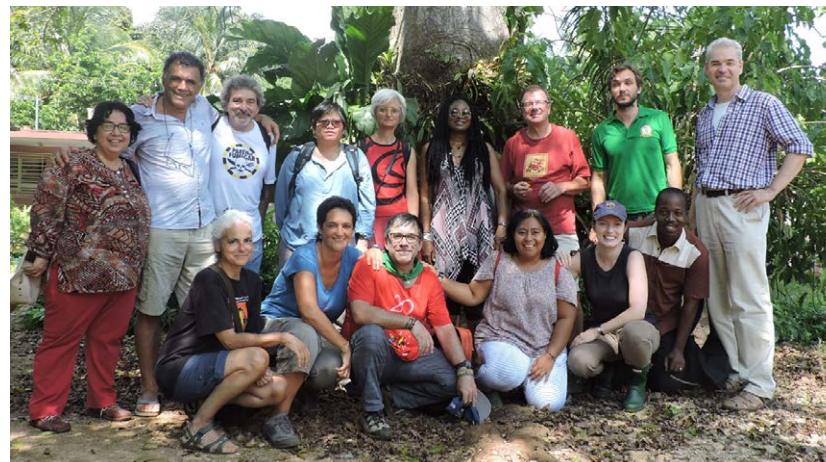
L'équipe de GRAIN et le conseil d'administration à Cuba en septembre 2016.

La rencontre annuelle de GRAIN de 2016 s'est tenue à Cuba et s'est avérée une opportunité très intéressante pour tous. Nous étions accueillis par le mouvement paysan cubain de l'ANAP [l'Association nationale des petits agriculteurs]. Depuis quelques dizaines d'années, Cuba a effectué une révolution agroécologique menée par l'ANAP. Deux séminaires ont eu lieu avec des membres de l'ANAP pour faire un échange d'expérience et à cette occasion, GRAIN a pu présenter le travail réalisé en Amérique latine, en Afrique et en Asie. Nous avons en outre rendu visite à quatre coopératives paysannes dans divers endroits de l'île, une expérience très enrichissante pour tous les participants. Nous avons par la suite publié un numéro spécial du magazine Biodiversidad sur l'alimentation et l'agriculture à Cuba pour partager plus largement nos échanges cubains.