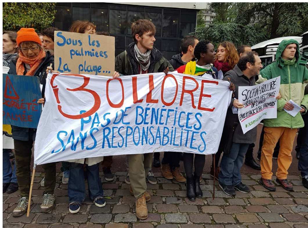
En 2016, nous avons soutenu les campagnes et les mobilisations contre l'accaparement des terres par l'entreprise Bolloré en Afrique et en Asie

Au Mozambique, nous avons travaillé avec des journalistes pour faire la lumière sur un scandale de corruption dans lequel les hommes d'affaires et les politiques locaux profitaient de transactions foncières dans le couloir de Nacala et parvenaient à dissimuler d'énormes sommes d'argent. En juin, nous avons participé à la Conférence lusophone sur l'accaparement des terres en Afrique à Beira, au Mozambique, avec 40 représentants des communautés locales. Nous avons également collaboré avec des groupes au Japon et au Brésil dont les gouvernements sont impliqués dans l'accaparement des terres par ProSavana au Mozambique, et nous avons soutenu le mouvement en traduisant et en diffusant l'information via notre site Internet farmlandgrab.org . Au Sénégal, nous avons soutenu les communautés qui s'opposent à Senhuile, une filiale du groupe financier italien Tampieri, qui a acquis 20 000 hectares sans consulter les populations.