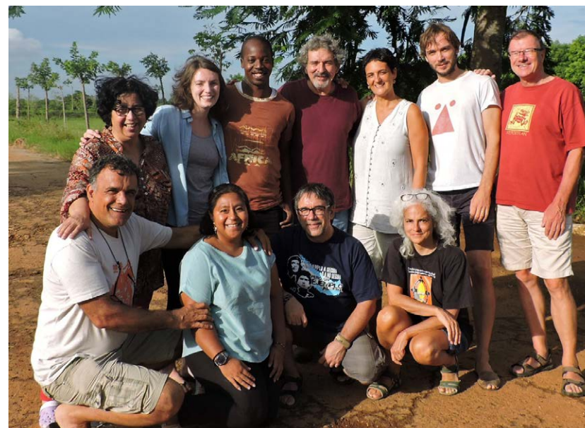
L'équipe de GRAIN en 2016