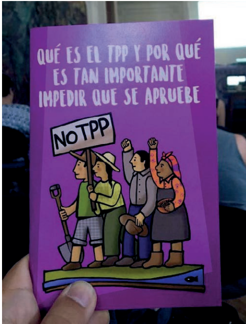
Un nouveau livret, co-publié avec le groupe de femmes rurales et autochtones ANAMURI, a contribué à sensibiliser les gens au TPP au Chili