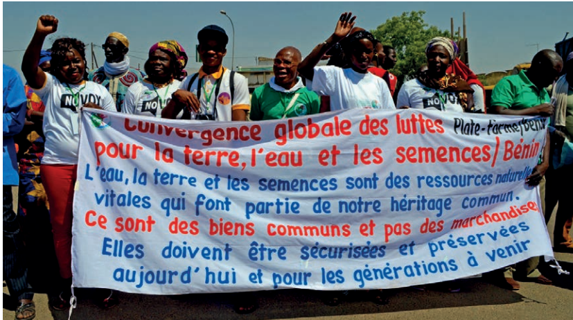
La Caravane ouest-africaine pour la terre, l'eau et les semences, mars 2016

de la Caravane ouest-africaine pour la terre, l'eau et les semences paysannes qui a eu lieu en mars. La caravane a traversé plusieurs pays dans la région et aidé à renforcer les communautés en lutte pour la maîtrise de la terre, de l'eau et des semences. Un Livret vert de la Convergence a été produit, qui analyse les problèmes, les propositions et les demandes des mouvements concernés. La caravane a été une telle réussite que l'expérience sera peut-être renouvelée l'an prochain en Afrique centrale.