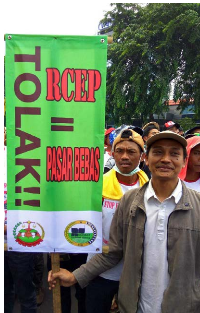
GRAIN a travaillé avec des groupes en Asie pour former des alliances et résister au RCEP

En 2016, GRAIN a sensibilisé aux conséquences des accords commerciaux internationaux, en se concentrant plus particulièrement sur les négociations du Partenariat régional économique global en Asie (RCEP), pour montrer comment cette transaction aurait une incidence directe sur les systèmes de semences paysans (voir encadré de la 3 e partie). Nous avons aussi beaucoup parlé du Partenariat transpacifique (TPP) : signé en 2016, cet accord établit de nouvelles normes de contrôle de la part des grandes entreprises qui menacent non seulement les petits producteurs alimentaires,