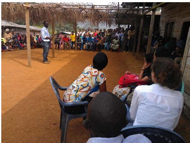
Atelier sur les stratégies des compagnies de palmier à huile, à Mundemba, au Cameroun

Nous continuons également à surveiller l'expansion des plantations industrielles de palmier à huile, l'une des causes majeures de l'expulsion des populations de leurs terres. En 2016, nous avons collaboré avec le World Rainforest Movement pour organiser un atelier qui s'est tenu en janvier à Mundemba, au Cameroun, réunissant une quarantaine de participants venus d'Afrique centrale et d'Afrique de l'ouest. L'atelier s'est conclu par la déclaration de Mundemba et déclaration de solidarité avec les peuples du Cameroun.