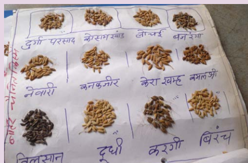
Diversité des espèces de riz au Madhya Pradesh, en Inde

Pour nous, le message est clair : les accords commerciaux constituent un outil clé pour forcer les agriculteurs à acheter des semences industrielles chaque année et arrêter de conserver leurs propres variétés, variétés d'une grande diversité qui sont adaptées aux conditions locales.