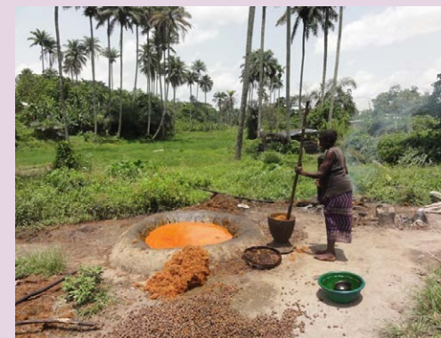
Production traditionnelle d'huile de palme en Guinée.

monde. Ce modèle de production est menacé par l'avancée rapide des plantations industrielles, les accords de libre-échange et les chaînes de valeur contrôlées par les grandes entreprises, au détriment des systèmes alimentaires fondés sur les communautés. La vidéo, réalisée en français, est disponible aussi avec des sous-titres en anglais, en espagnol et en indonésien.