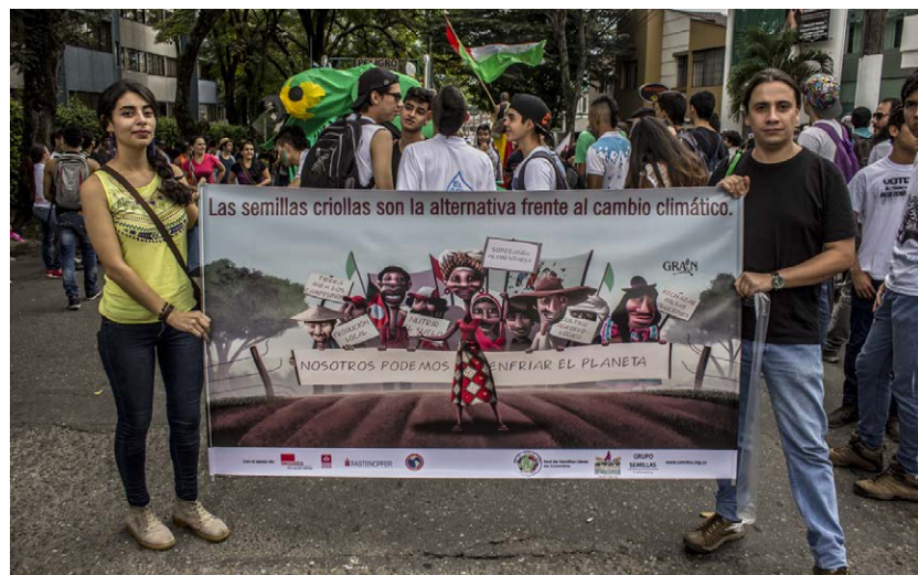
Marche des semences en Colombie avec des bannières réalisées par GRAIN et La Via Campesina.

avons aussi soutenu des groupes maliens dans leur travail sur les lois semencières et participé à une rencontre en Ouganda pour essayer d'organiser des formations sur les semences en Afrique de l'Est, avec l'Alliance pour la sécurité alimentaire en Afrique [l'AFSA, Alliance for Food Sovereignty in Africa] et Réseau africain de la biodiversité [African Biodiversity Network]. Nous avons soutenu l'organisation en Afrique francophone d'un nouveau cours sur les semences et l'agroécologie qui devrait, nous l'espérons, devenir une plateforme cruciale dans la région pour former des professionnels, des agriculteurs et des activistes. La première édition du cours s'est tenue sur deux semaines au Bénin en décembre.