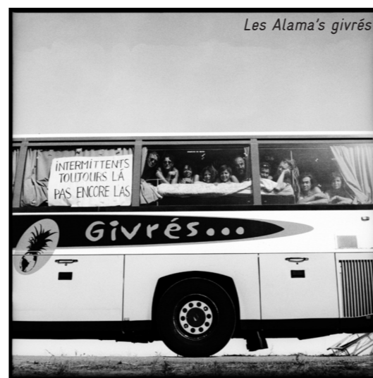
Les Alama's givrés

Ce modèle est celui d'une possibilité d'une autre sortie du chômage de masse et de la précarité pour tous, grâce à la construction d'un deuxième pilier de la protection sociale qui fonderait des droits à un salaire continu pour les salariés à l'emploi discontinu. Et ce modèle serait de très loin plus crédible et moins coûteux que les promesses de plein-emploi et que les cadeaux du « pacte de responsabilité » au patronat. »