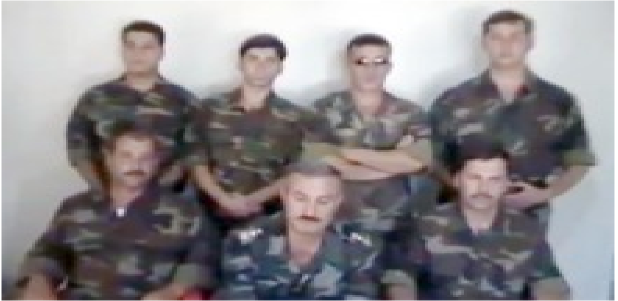
FSA leader, and former Colonel, Riad al-Asaad and others announcing the FSA's formation in late July 2011 |