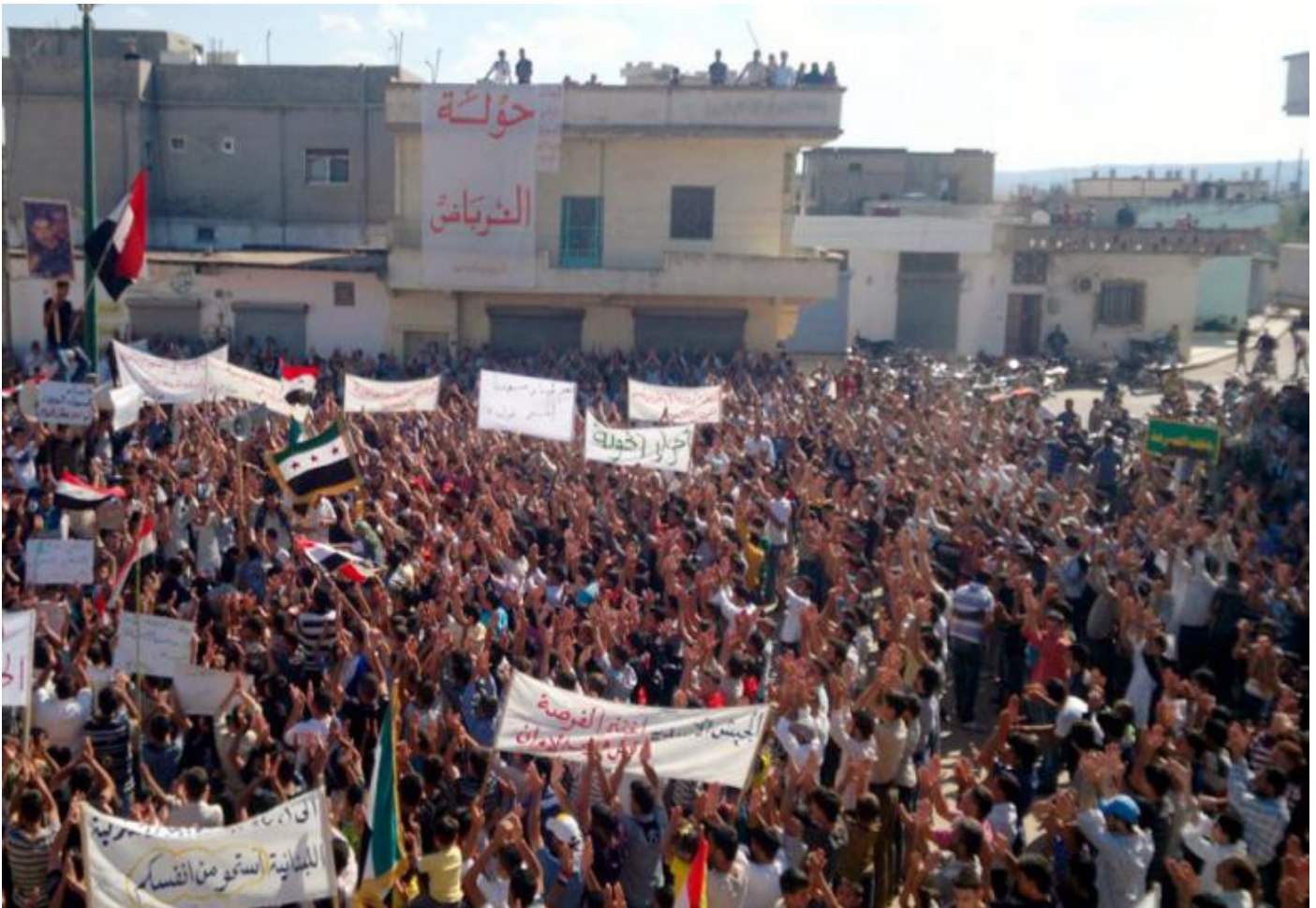
خویشاندان له شاری، Hula، نزیک به Homs 14 October 2011

به هۆی ئاماده بوونی دهوله ته کان (به تایبه تی ئیران، تورکیا، سعودیه و ئیسرائیل و سوریا خویشی)، وه خویندنه وهی به رده وامیان یوهیژوو لاوازیه کانی بزووتنه وهی پرولیتاریا له ناوچه که دا، وه ئاستی به رزوونزمی ئه م بزووتنه وهیبه له ئوردن و یه مهن و تونس و میسردا، زهق بوونه وهی لاوازیه کانی، ئه مه هیژی ده ستهپیشخه ری کردنی دایه هیزه کانی دژه شورش له ناوچه که دا بو کردنی لاوازیه کانی بزووتنه وه که به جهنگی ئینته ر یورجوازی، به شه پی شیعه و سونی، به خه بات بو دپو کراسیه ت، به خه باتی