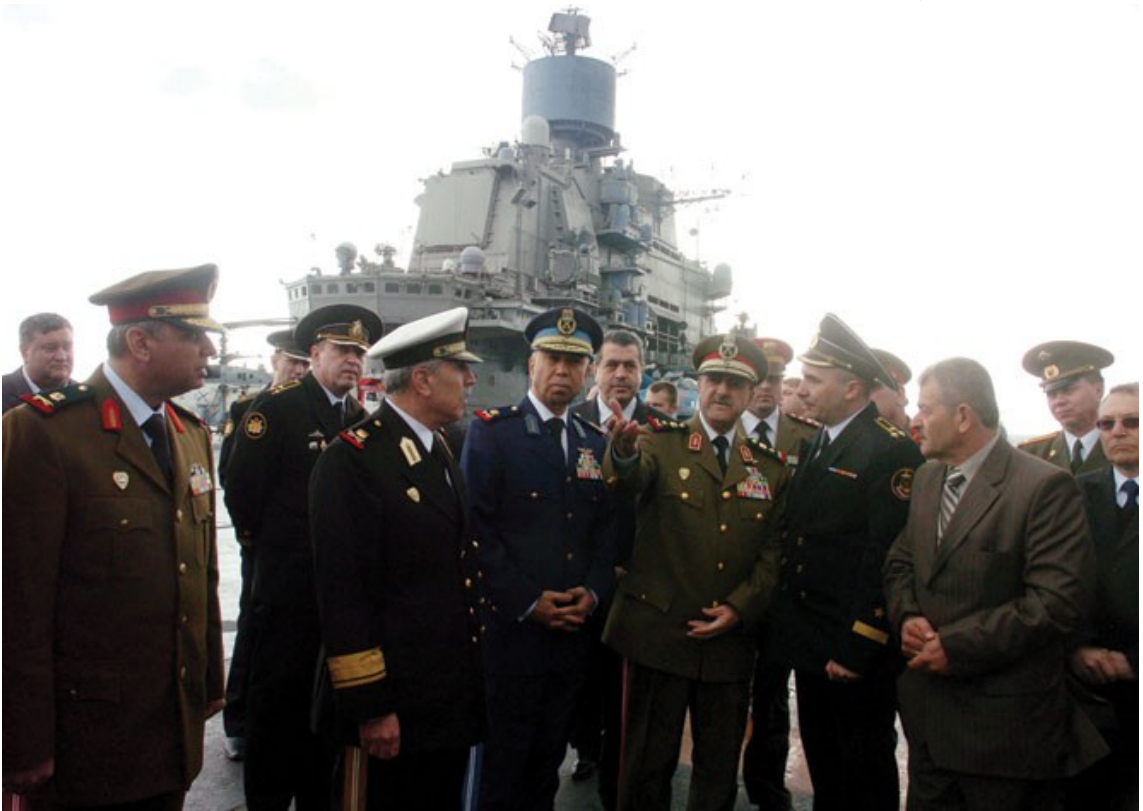
Minister of Defense General Dawood Rajiha visits Russian aircraft carrier, January 8-2011

به هوی ئه م زه مینه ده ستپیشخه ربه وه کاتیک که پرولیتاریا هاته سه ر جاده کان له سوریا دا ، ده وله تی سوریا و تورکیا و ئیران و سعودیه و ئه وانی تر ده میک بوو هیزه کانی خوینان ئا ماده کرد بوو بو به ره نگاری بوونه وهی هیزه چینایه تیه کانی ئه م بزووتنه وهیه و قوستانه وه و ئه م لگام کردنی لاوازیه کانی له شه ریکه ئینته ر یورجوازی دا . ئه م هه ره له سوریا دا نییه ، به ره له سوریا ، له ئوردوندا شه ره کان به ریان پیگیرا به ریکه وتی نیوان شا و ئیسلامیه کان ، له تونسدا فه رسا ئیسلامیه کانی هیئایه سه ر ته خت و هیزی تیروریزی ده وله تی خسته ده ستیان (هه روه کو ئیران له 1977دا) ، له میسر دا به دوو قوناغدا به ریوه چوو ، به کم به ریکه وتی نیوان ئیسلامیه کان و سوپا بو به رگرتن به ریا دیکال بوونه وه و کومه لابه تی بوونه وهی بزووتنه وه که ، به هیئانه سه ر ته ختی ئیسلامیه کان ، دووم به به ره ره کانی نیوان سوپا و ئیسلامیه کان ، وه کو دوو لایه نی دژ به یه ک ، وه کوده تایی سوپا به سه ر ئیسلامیه کاند او تیروری سوپا به دژی به ره ره کانی ور په گه زه شو ر شگیزیه کان له سه ر ئاستی وولات . له به حرین دا به خه باتی که مایه تی بو مافه دیموکراتیه کانیان . له یه مهنده به خه باتی به رامبه ربه یه ک خیزانی دیکتاتور و لابر دنی ، له سووریا شدا به شه ری نیوان دژه ئه سه د و دژه داگیرکه ر