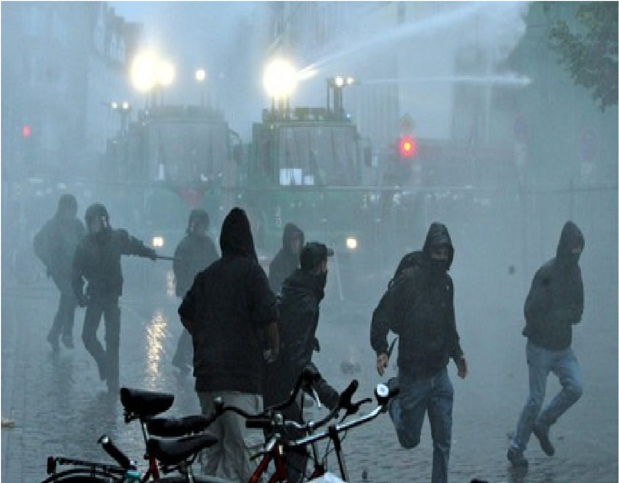
London August 2011

رپا په رپنه ی تردا که له دژی هه مان چه وساندنه وهی چینایه تی وهك گيژه لووکه له سه ر ئاستی جیهان نه خوولیتنه وه . به م پی.یه نه میاخی بوونه له دیکتا توریه تی به هاو به دژی لایه نه کانی نه م دیکتا توریه ته خوړا پسکاندننی راسته وخوی پرولیتاریایه له دژی کویلابه تی وله پیناوی ژیاندا . خه باتی راسته وخوی پرولیتاریایه له دژی چه وساندنه وه ، له دژی که له که بوونی سه رمایه و به ره مه کان ، له دژی داماووی ژیان ، له دژی ده ولت