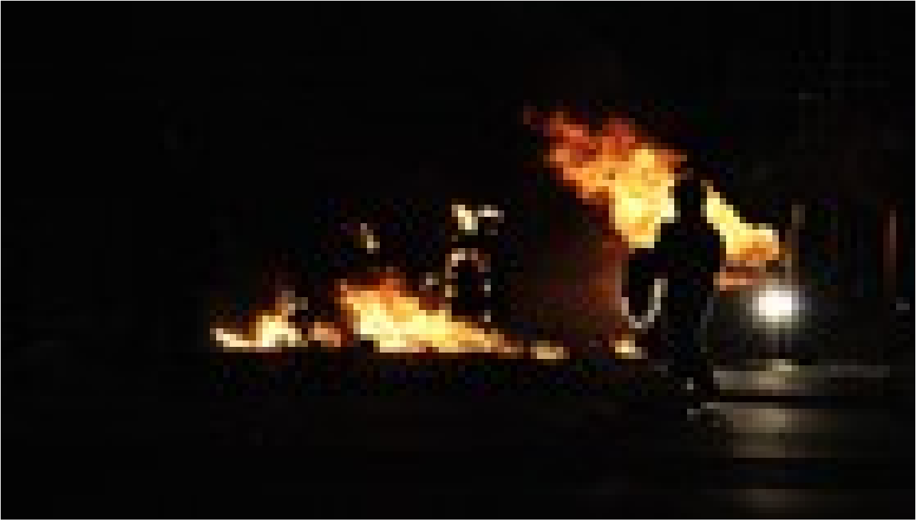
A young law student from London talks about smashing up a car showroom and setting fire to a sports car