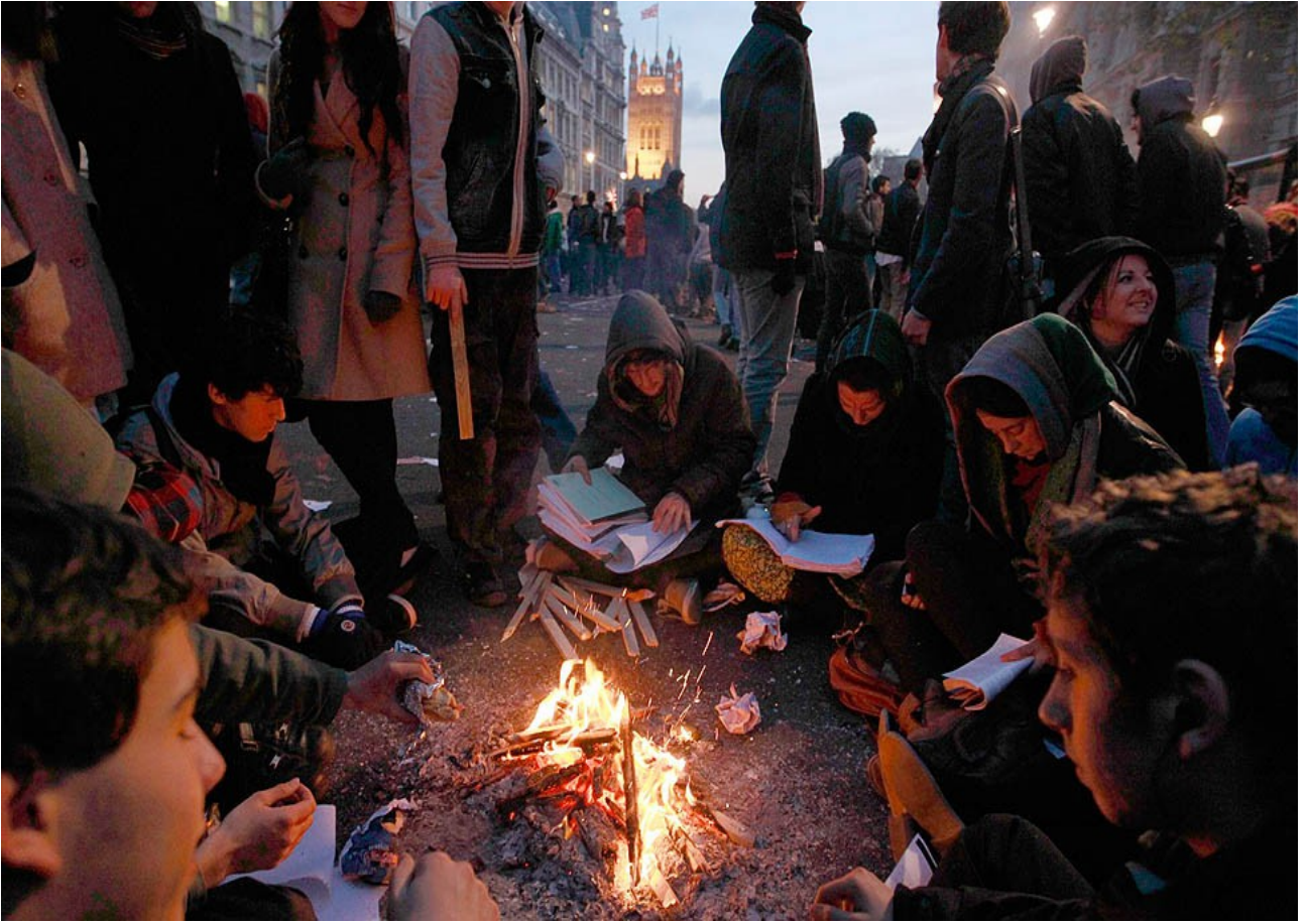
دوونمونهی جی‌اواز له خوږه ده‌سته‌وه‌دان، له چوک‌دادان، له چاوه‌پروانی، له هیڼزی دیموکراسی‌ت و به هیڼزی ده‌وله‌ت