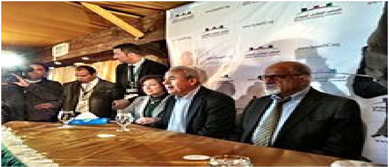
Syrian opposition first congress in Tunis , 19 December 2011