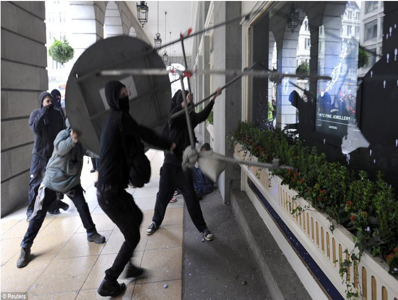
Central London ، March 26, 2011 the Ritz Hotel

که ئەم کارە بکەن . ئەمەش جوړیکە لە تەعدا کردن له دانیشتوانی ناوچه که ، که بەرپه چه له كئته فرو- کارپین وله رپا بردووشدا بەر بەرە کائیی زوریان له گەل پۆلیسدا هه بووه و هه ر ئه و پرقه یه درئژ بۆ ته وه بۆ ئە مړۆ (1)