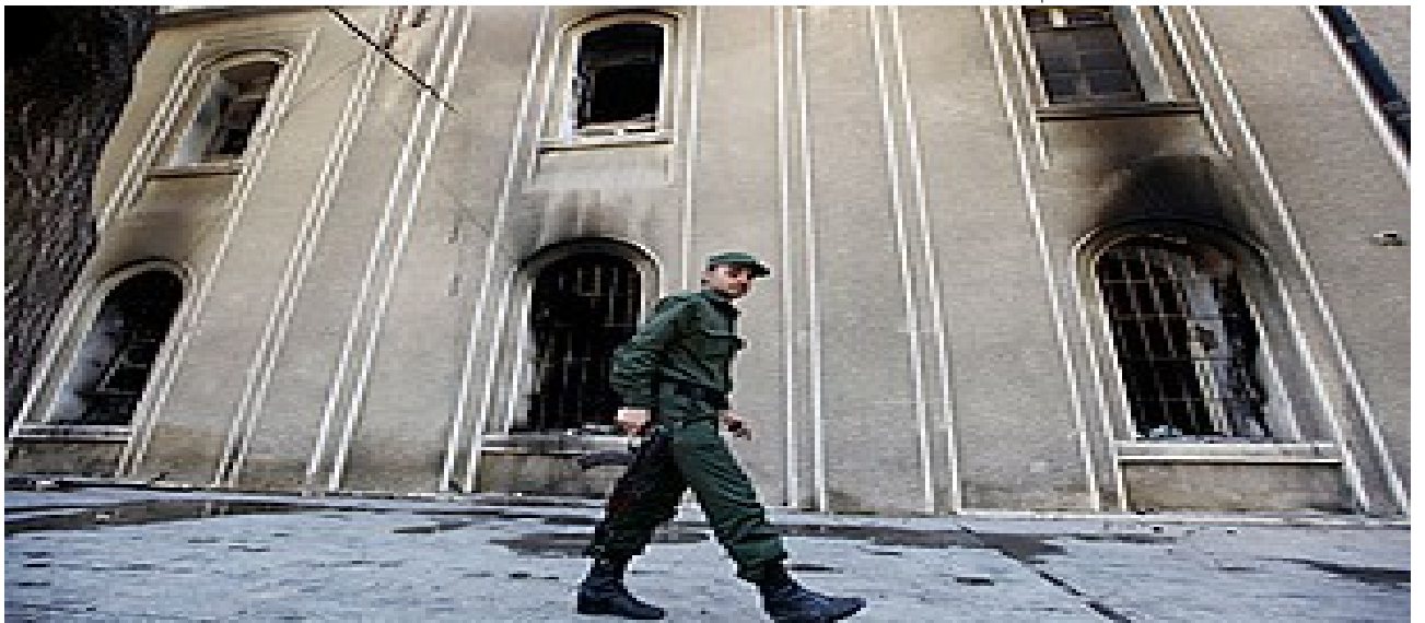
March 21, 2011 دادگا يە كى سووتە ۋە دەستى راپەرىجوان لە شارى دەرعە

لە سورىادا ، بەرپا بوونى راپەرىن وھاتنە سەرجادەي گەنجە كان لە شاروشاروچكە كاندا (لە سەرەتادا لە شارى دەرعە و دواتر بۆ شاروشاروچكە كاتى تەرد) ، ۋە بەردباران كەردن ۋە پەلاماردانىان بۆ سەرھىزە كانى ئاسايش ۋە دام ۋە دەزگا كانى دەولەت ، ئەتوانرېت ھەم لە پرووى بلاۋبوونە ۋە ھەم سەردەمەي شەپۇلى خەباتى پرۇلىتارىا لە ناوچە كەداكە لە تونسە ۋە دەستى پىكرد ، ۋە ھەم لە پرووى ياخى بوونى چەوسا ۋە كان لە سورىادا لە مېژووى جھنگو سەركوت كەردن ۋە چەوساندنە ۋە ھەم چىنايەتى و تىرۇرى دەولەت (ھەر ۋە كو عىراق لە 1991 دا) سىر بىكرېت . لە ھەر پرووى كە ۋە بۆي دېيت ئەم خەباتە ، ھەر ۋە كو ئە ۋە ھەم لە يەمەن و ميسرو تونس و يونان دا ، ياخى بوونە لە ژيانى كارى كرى كرتە ، لە دموكراسيەت ، لە خاۋەندارىيەتى ، لە دەولە مەندى ۋە فەقىرى ، لە بەرزوونزىمە ئابوورى و سىاسى و سەربازى و ئاسايشە كانى ئەم ژيانە . لە بەر ئە ۋە ھەم ئەم ژيانە سىستەمىكى ئىنتەرناسيونالىستىيە ، بەرزوونزىمە كانى لە سەرناسىتى جىھانى شەپۇل ئەدەن ، دياردە ناو خۇبى و ناوچە يە كانى لە وشە پۇلە دا بەر يەك ئە كەون ، ئە سوپىن و خۇبان تازە ئە كەنە ۋە ، بە گشتيش دىكتاتورىيەتى سەرمایە ئە نوپىن ، خەباتىش بە دژى خەباتىكى چىنايەتى پرۇلىتارىايە و سەربە وشە پۇلە يە لە خەباتى ئىنتەرناسيونالىستى كە پرۇلىتارىا لە م پۇدا تيا ئە ژى دژى دىكتاتورىيەتى جىھانى سەرمایە . گورپە پانى ئەم خەباتە سىستەمى كارى كرى گرتە يە ، دوژمنە كەي دىكتاتورىيەتى جىھانى سەرمایە يە ، بە ھەموو دام ۋە دەزگا ئابوورى و سىياسى و دىنى و نە تە ۋە يە جۇرا و جۇرە كانى ۋە .