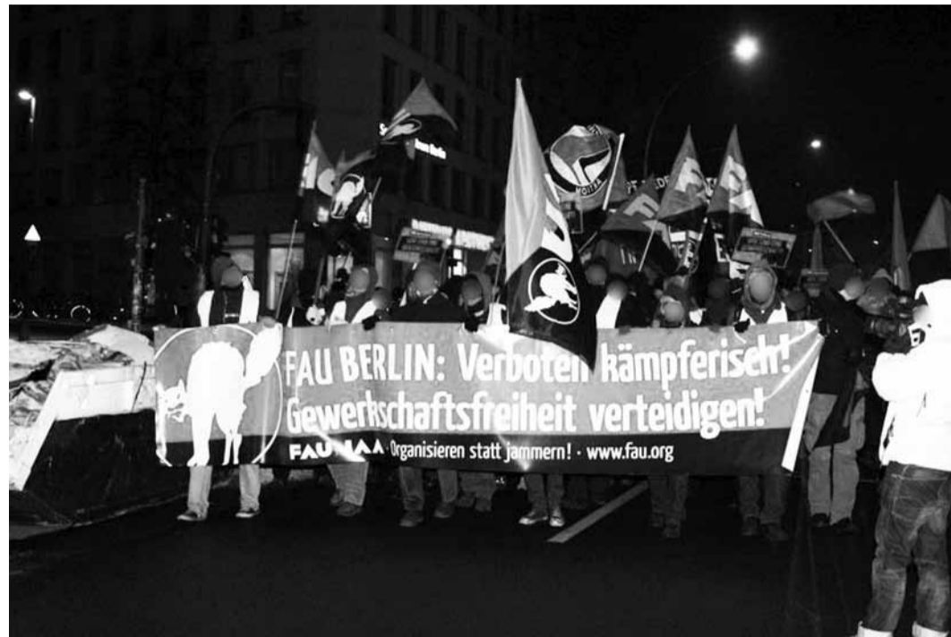
Demo der FAU Berlin.

schaft darf sich nun wieder Gewerkschaft nennen. Die Frage der Tariffähigkeit wurde im Urteil aller-