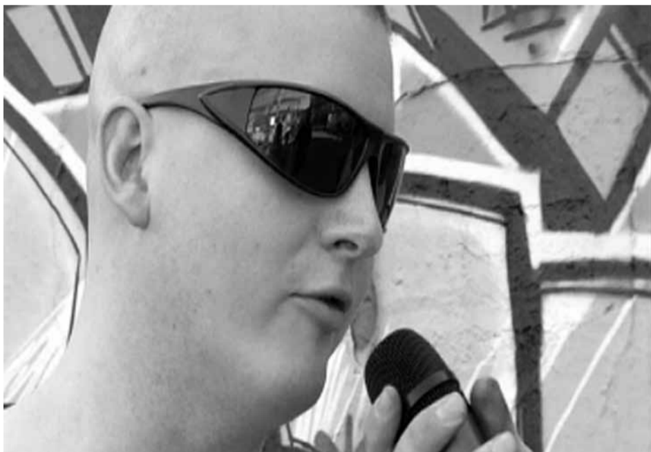
Nico von K.I.Z.

Ihr hattet zur Antifaschistischen Demo in Dresden aufgerufen, habt gesagt, ihr kommt vielleicht auch hin. Warst du da, hast du vielleicht sogar einem Nazi auf die Birne gehauen?