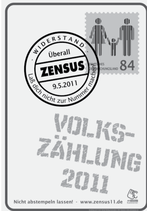
Plakat des AK-Vorrat gegen den Zensus.

Und nun sollen 2012 auch alle EinwohnerInnen komplett durch gezählt werden. Anders als 1987, als die Zählung auf 60 Millionen Menschen kam,