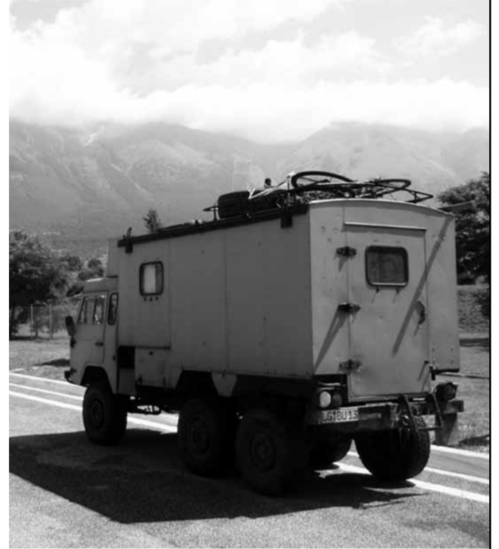
Mit diesem Auto war graswurzel.tv während des G8-Gipfels in Italien unterwegs.

der Baustelle des Kohlekraftwerks Moorburg in Hamburg nicht nur Demonstranten verprügelt, sondern auch das graswurzel.tv -Team von der Hamburger Polizei angegriffen: „Nachdem wir einen prügelnden Beamten filmten, kam dieser zielgerichtet auf unseren Kameramann zu und entriss ihm seinen Presseausweis. Danach wurde auf ihn mit Schlagstock und Fäusten eingeschlagen. Weder Dienst- noch Zugnummer wurde uns von diesem Beamten mitgeteilt“, schrieben die FilmemacherInnen damals in einer Stellungnahme. Der brutale Angriff der Polizisten auf DemonstrantInnen und das Filmteam führte später zur Anklage gegen die Täter – Demonstrationen filmisch zu begleiten kann also auch Vorteile für die Demonstranten haben. Zumindest, wenn es die Leute von graswurzel.tv sind!