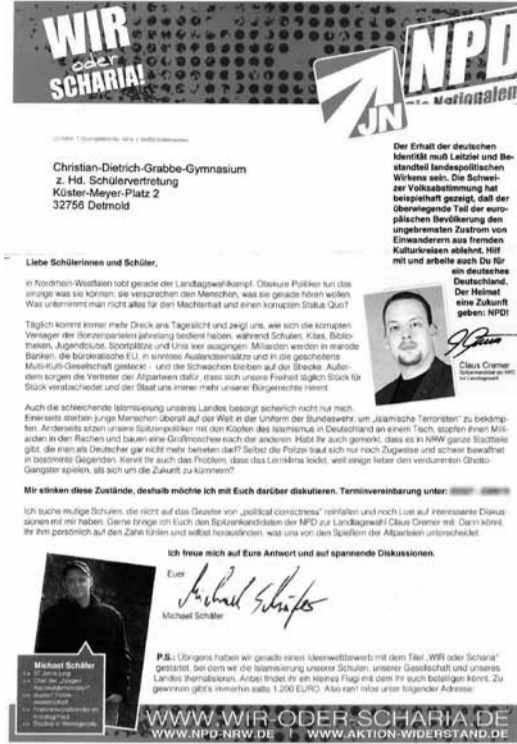
Diesen Brief verschickte die NPD in NRW an Schülervertretungen.

Auch für die Landtagswahl in Mecklenburg-Vorpommern 2011 wurde eine Schulhof-CD veröffentlicht. Der Titel: „Freiheit statt BRD“. Die CD