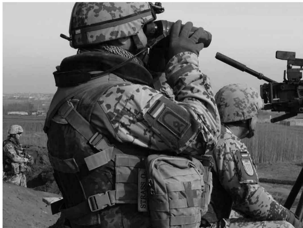
Die Bundeswehr im Einsatz in Afghanistan.

schießen. Ich denke, wir sind inzwischen in einer Situation, in der es gar nicht mehr darum geht, die rohstoffreichen Länder zu besetzen. Viel wichtiger sind heute die Transportwege. Das sind die geostrategischen Zusammenhänge mit denen wir heute zu tun haben. Riesige Mengen des in westlichen Ländern benötigten Öls werden heute über den Indischen Ozean transportiert. Auch