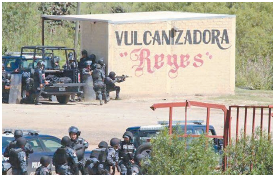
Policías federales usan armas de fuego contra los manifestantes en Nochixtlán, Oaxaca.