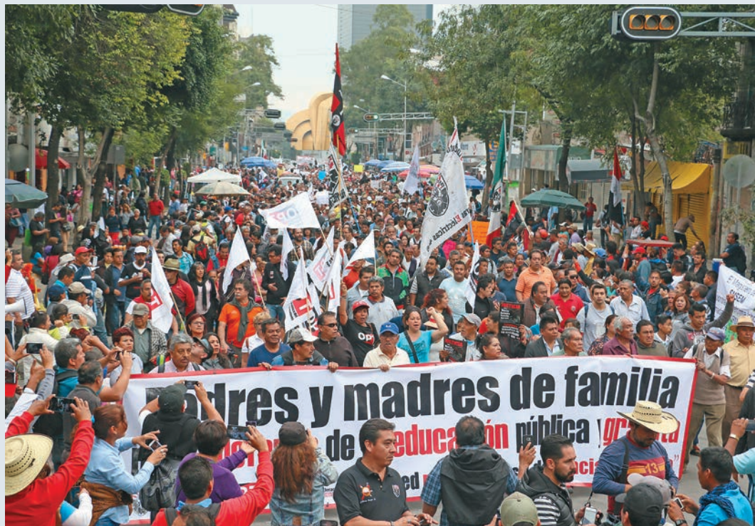
Marcha nacional de la CNTE, Paseo de la Reforma, ciudad de México

La lucha no es meramente gremial, sino popular