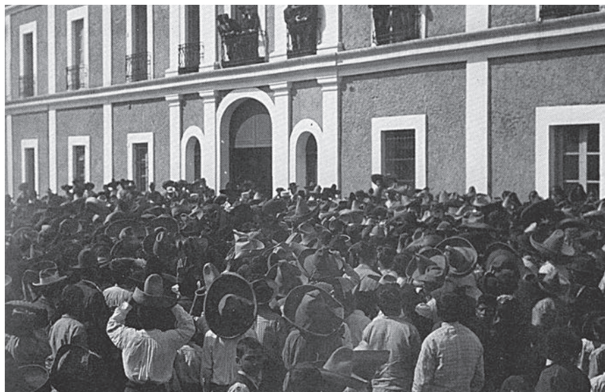
Huelga de trabajadores textiles en Río Blanco, Veracruz que estalló el 7 de enero de 1910.

Se ha propiciado para los trabajadores el empobrecimiento y la desposesión, como señala Eduardo Colombo, “de su propia historia que fue escamoteada por las ideologías triunfantes [...] que lograron hacer caer en el olvido la experiencia revolucionaria de toda