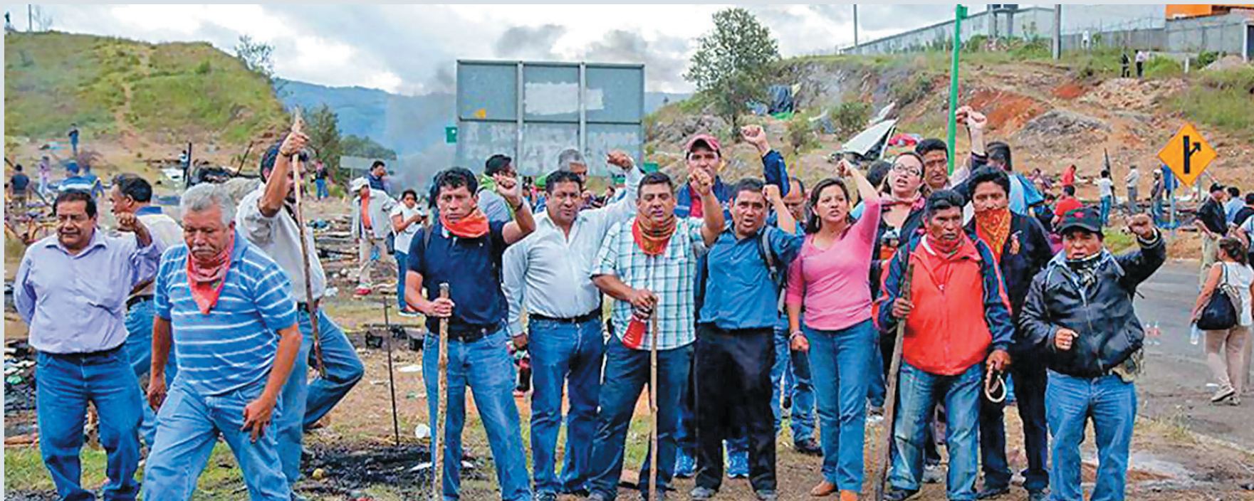
El 20 de julio de 2016, paramilitares apoyados por las fuerzas policiales atacaron a los maestros que mantenían un bloqueo en San Cristóbal de las Casas, Chiapas, pero a las pocas horas del mismo día, y arrojados por el pueblo que salió en apoyo al movimiento, se retomó el campamento. En la foto, celebración por la reinstalación del bloqueo.

Es común pensar que el Estado es un mal necesario, que a pesar de que estemos en resistencia contra alguna de las cabezas de la hidra capitalista, debemos exigirle, demandarle que resuelva lo que los de arriba provocan, increparlo y tratar de usar sus armas legales en su contra. Olvidamos que el Estado en el presente, como a lo largo de la historia, siempre ha significado guerra contra la vida, por tanto, tenerlo como interlocutor es dejarse capturar en su red y en su estrategia de contrainsurgencia. Por eso es necesario pensar y hacer la resistencia con rebeldía, es decir, destruir aquello que destruye nuestra capacidad de hacernos cargo de nuestra vida, crear en el mismo instante que luchamos el mundo nuevo que deseamos: uno sin jerarquías y sin explotación; por eso requerimos no entrar en el juego del Estado, por el contrario, nos ubica como antagonistas de éste, implica una práctica que no se deja cooptar, que no cae en la tentación de competir en la correlación de fuerzas asimétricas que imponen el capital y el Estado, conlleva no declararnos derrotados por la vía de los hechos. No se trata de negar la existencia del Estado o pensar que podemos ignorarlo, sino de negarnos a negociar con él o pedir que resuelva lo que no seamos capaces de sostener y construir con nuestra propia capacidad de organización y lucha.