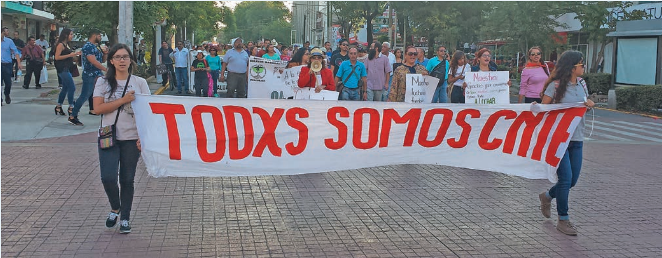
Marcha en apoyo a la insurgencia magisterial en Guadalajara, el pasado 29 de julio de este año.

LA COORDINADORA Nacional de Trabajadores de la Educación (CNTE) se debe a la inconformidad de los trabajadores de la educación (maestros, administrativos, técnicos y manuales) de los años setenta del siglo XX en contra de las políticas laborales, educativas y sindicales prohijadas por el Estado mexicano.