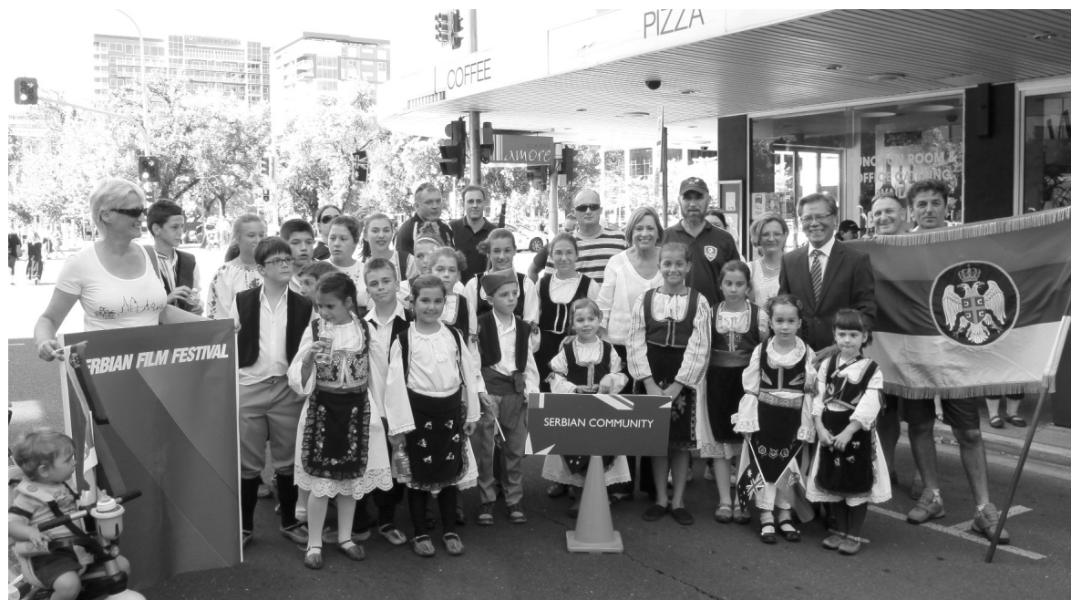
Српски дан у Аделаиду 2007. године

политичкој потреби странака на власти - да је што већи број наших људи у расејању, то су они и њихов егзодус већи национални и државни проблем. Отуда је број Срба у расејању нарастао на чак четири милиона. Политичари воле о томе да говоре као о парадоксу да „нам више од трећине народа живи ван отаџбине“.