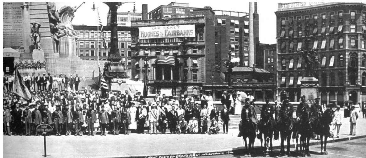
Сабор друштва Сокол, Индијанополис (САД), 1916. година