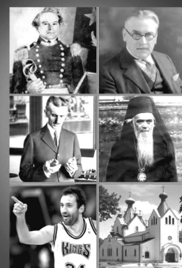
Насловна страна књиге „Енциклопедија српске дијаспоре“

ENCIKLOPEDIJA SRPSKE DIJASPORE SRBI U PREKOMORSKIM ZEMLJAMA