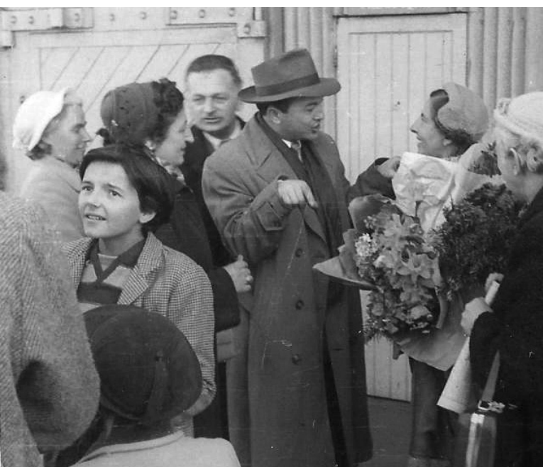
Дочек Срба исељеника у Сиднејској луци 1955. године