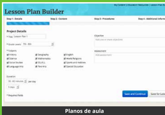
Planos de aula

A interface atualizada e atraente do portal facilita a transição entre os módulos de ensino (Fundamental I, II e Médio) de maneira fácil, de acordo com os diferentes níveis de compreensão dos alunos. Conteúdo confiável e relevante para cada nível do aprendizado.