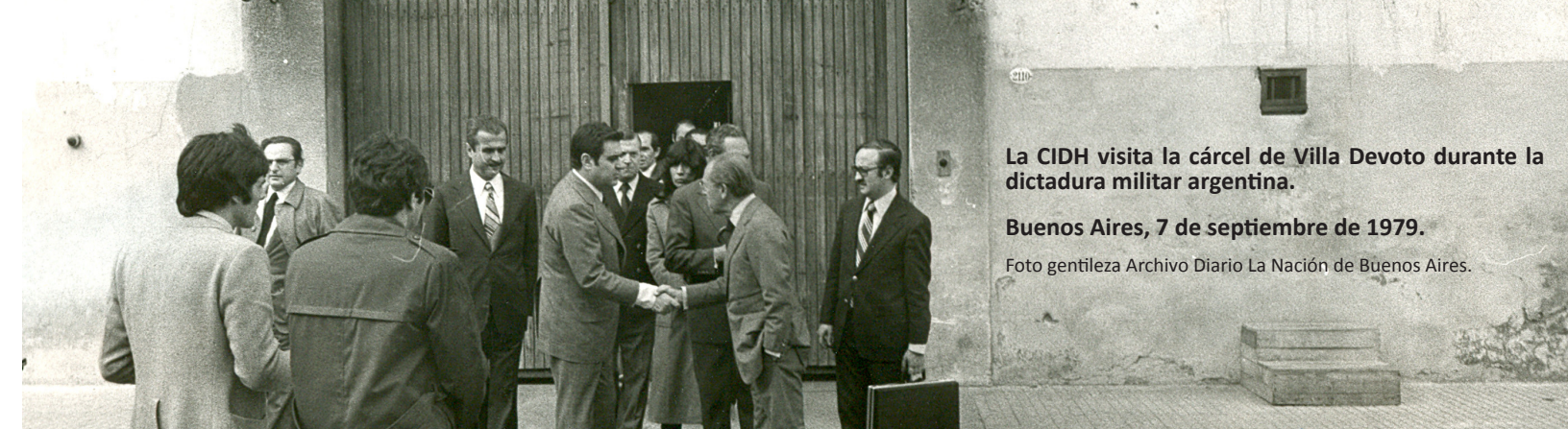
La CIDH visita la cárcel de Villa Devoto durante la dictadura militar argentina.