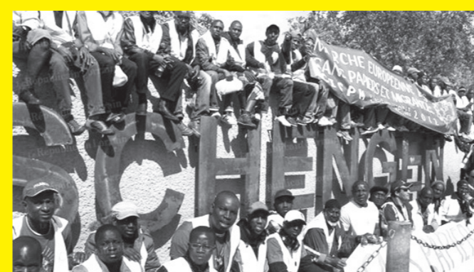
Marche Européenne des Sans-Papiers et Migrants (Schengen/Luxembourg 2012)

This map is a follow up of the transborder conference in Istanbul 2012 Cette carte est née en 2012, suite à la transborder conference à Istanbul