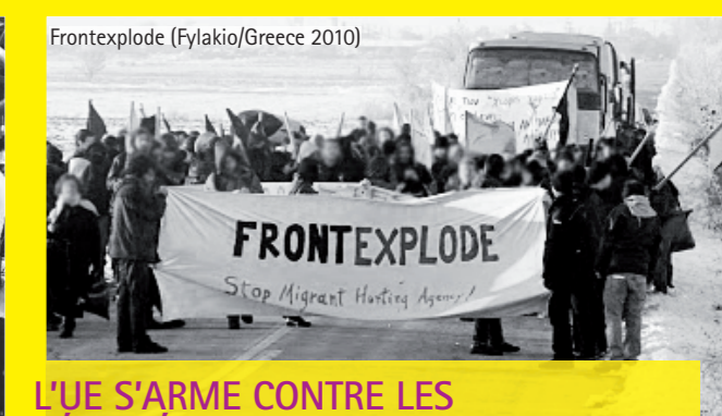
Frontexplode (Fylakio/Greece 2010)