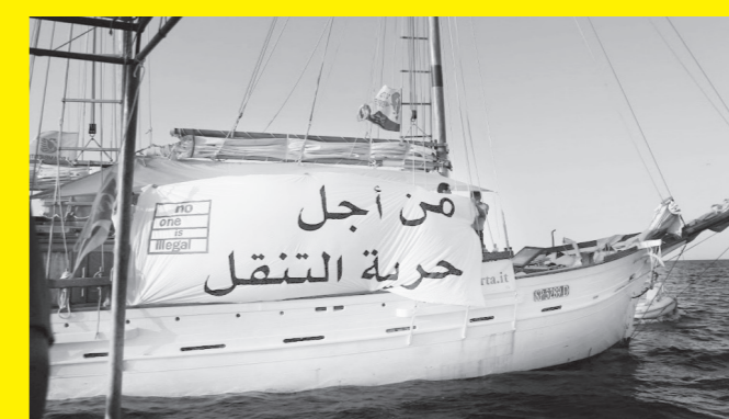
Boats4People (Tunisia 2012)