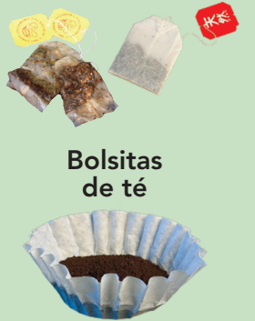
Bolsitas de té