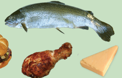
Carne, pescado y lácteos