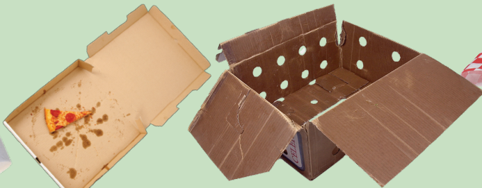
Cajas de pizza con grasa y cajas de cartón enceradas