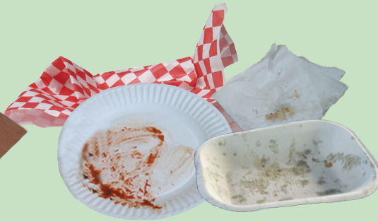
Platos de papel sin recubrimiento y servilletas