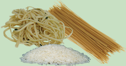
Pasta y arroz