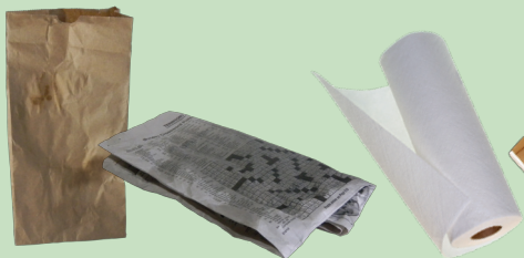
Bolsas de papel, papel de cocina y periódicos