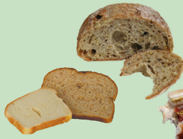
Pan y granos