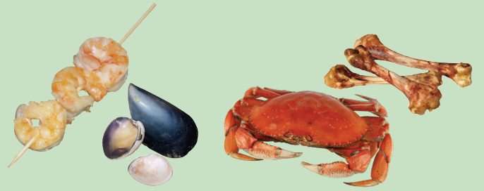
Cáscaras y huesos