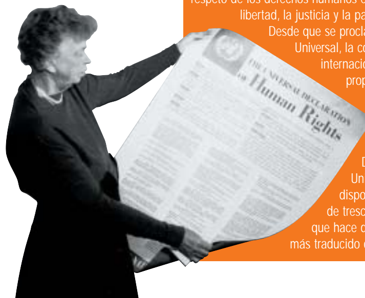
Eleanor Roosevelt condujo y presidió la comisión que desarrolló la histórica Declaración Universal de Derechos Humanos.

Desde que se proclamó la Declaración Universal, la comunidad internacional se ha propuesto una labor continuada: hacer efectivos los ideales de la Declaración. La Declaración Universal está disponible ahora en más de trescientos idiomas, lo que hace de ella el documento más traducido del mundo.