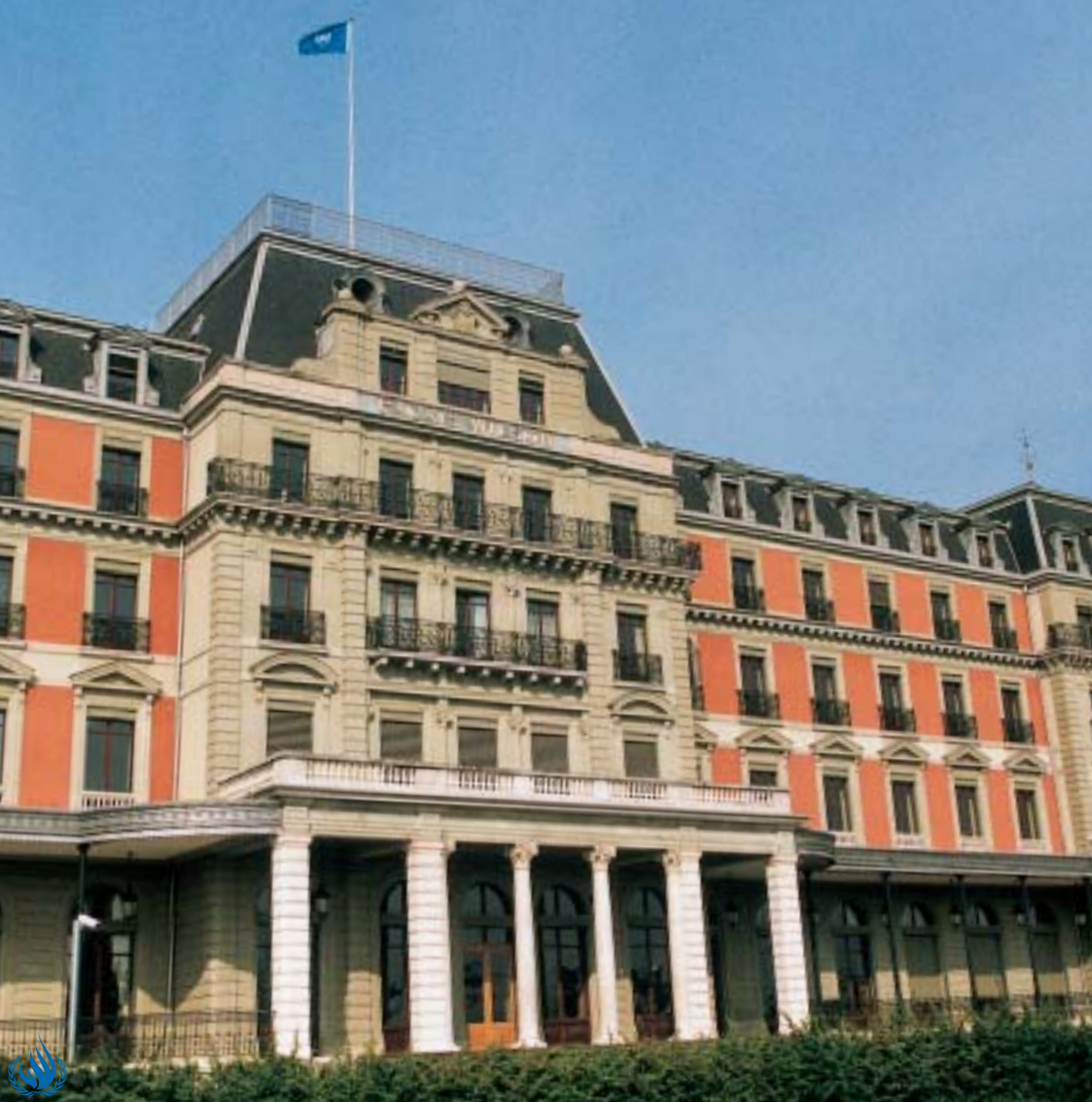
El Palais Wilson acogió la Sociedad de las Naciones y es ahora el hogar de los derechos humanos.