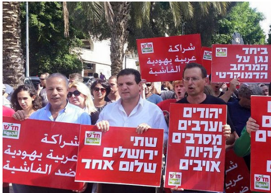
חברי כנסת של חד"ש בהפגנה נגד הכיבוש בשנה שעברה

בהקשר הזה, חשיפת מפגש הפסגה שנערך בעקבה בכברואר 2016 בהשתתפות ג'ון קרי, שר החוץ של ארה"ב, נשיא מצרים א-סיסי, מלך ירדן עבדאללה וראש הממשלה נתניהו, שבה ולימדה, כי נושא ההסדר המדיני דווקא אקטואלי וכי קיימת תמיכה בינלאומית ואזורית בתכנית לסיום הכיבוש ולשלום ישראלי-פלסטיני. המכשול העיקרי ליישומה הוא המדיניות הישראלית הרשמית, החותרת להנצחת הכיבוש הישראלי, הנישול וההתנחלויות.