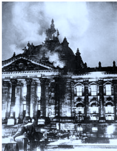
שריפת הרייכסטאג ב-1933, אירוע שניצלו הנאצים לביטוס שלטונם

תחום התרבות היה תחת פיקוחו של שר התרבות יוסף גבלס שפיקח על כל אמצעי התקשורת, העיתונים, כתבי העת, הספרים שהודפסו, המפגשים הציבוריים, האמנות, המוזיקה, התאטרון, הסרטים והרדיו. בתחום הדת ניסו הנאצים לאחד את הפרוטסטנטים (67%) לכנסייה פרו-נאצית ולהכפיף את הקתוליות למשטר כמה מהכנסיות הפרוטסטנטיות נאסרו. כמו כן הקימו הנאצים מיליציות פוליטיות מזוינות לחיסול מתנגדיהם ולהשלכת חתימתם על האוכלוסייה (SA-SD).