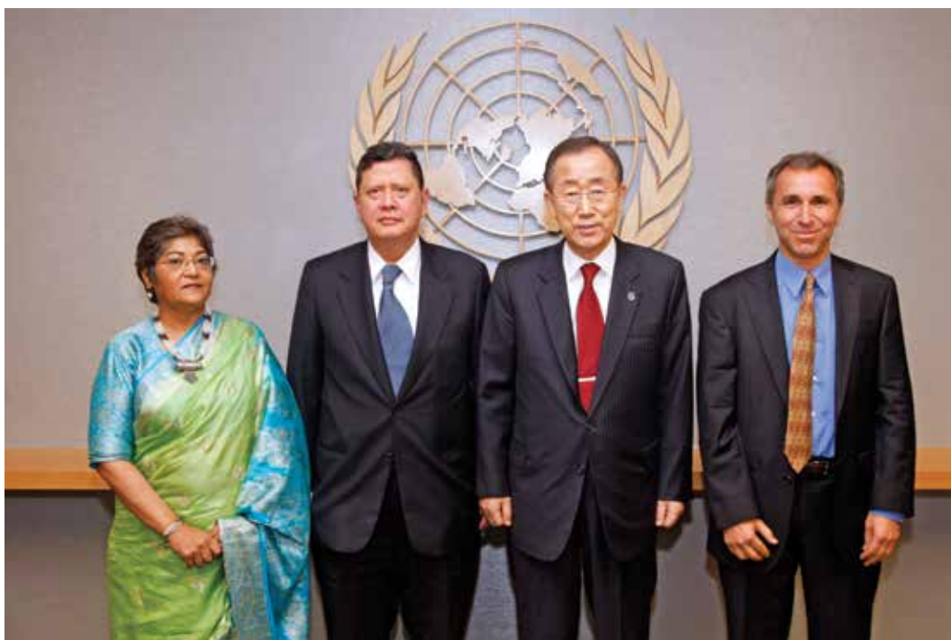
El Panel de Expertos creado por el Secretario General sobre Rendición de Cuentas en Sri Lanka.