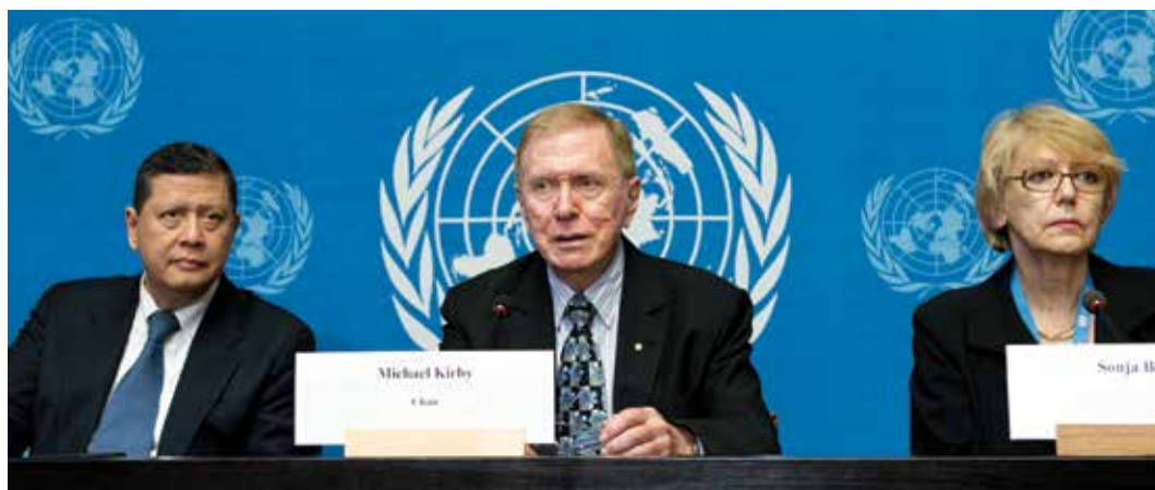
Conferencia de prensa de la Comisión de Investigación sobre los derechos humanos en la República Popular Democrática de Corea.

Las comisiones/misiones pueden usar el sitio de Internet del ACNUDH para divulgar información al público. Por ejemplo, ha llegado a ser una práctica habitual que las comisiones/misiones creadas por el Consejo de Derechos Humanos establezcan una página de Internet en la sección dedicada al Consejo dentro del sitio de Internet del ACNUDH para divulgar información de contacto, comunicados de prensa e informes preliminares.