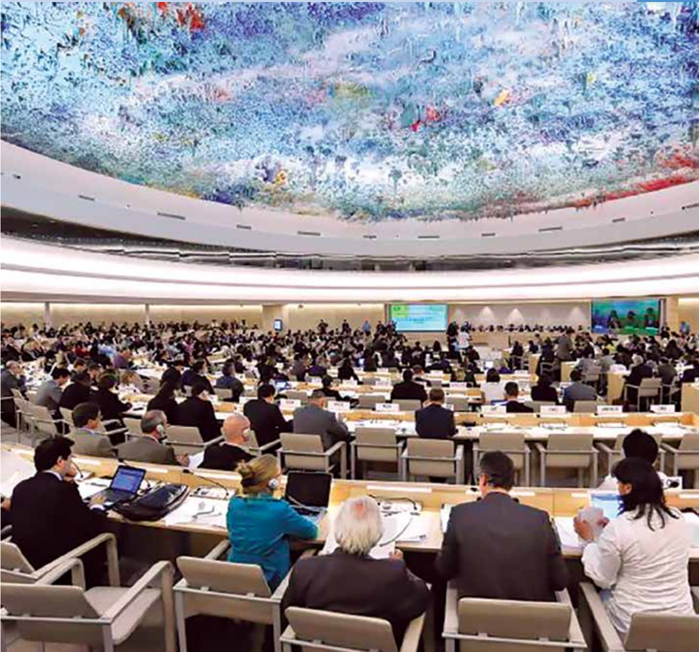
Una sesión del Consejo de Derechos Humanos.