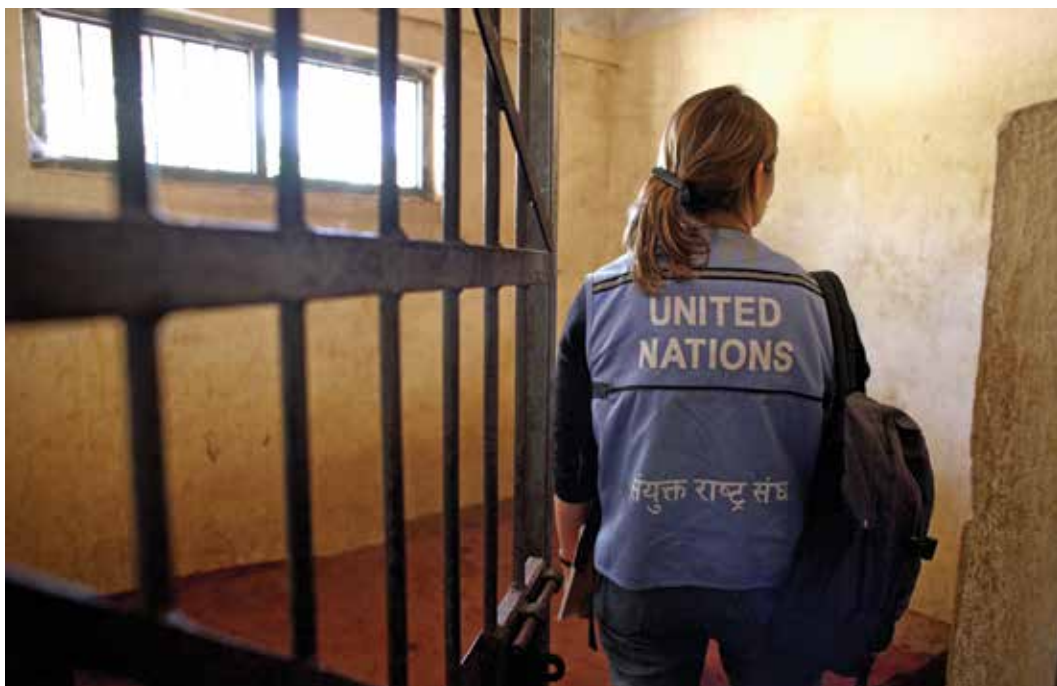
Una oficial de derechos humanos del ACNUDH visita un centro de detención en Nepal.

consiguiente, el ACNUDH opera como un repositorio de la memoria institucional en lo relativo a la creación y el funcionamiento de estos órganos.