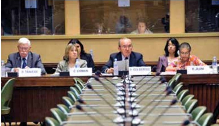
La Misión de Investigación de las Naciones Unidas sobre el Conflicto de Gaza durante audiencias públicas celebradas en Ginebra.

y sería usurpar las facultades del Consejo” 50 . En Gaza (2009), donde la resolución del Consejo de Derechos Humanos exigió que la Misión investigara las violaciones cometidas por una de las partes 51 , el Presidente del Consejo 52 , al anunciar la creación de una Misión de Determinación de los Hechos, y en las cartas en las que designó a sus miembros, pidió “investigar todas las violaciones de las normas internacionales de derechos humanos y el derecho internacional humanitario que pudieren haberse perpetrado en cualquier momento en el contexto de las operaciones militares que se ejecutaron en Gaza durante el periodo del 27 de diciembre de 2008 al 18 de enero de 2009, ya fuere antes, durante o después de él” 53 . Este enfoque amplió el ámbito del mandato para incluir a todas las partes pertinentes. En los casos en que los mandatos han incluido el cometido de investigar violaciones del derecho internacional humanitario, las comisiones/misiones han aplicado ese derecho a todas las partes en el conflicto armado, incluso a los grupos armados no estatales. De modo análogo, las comisiones/misiones han aplicado el derecho penal internacional pertinente a los actores no estatales (por ejemplo, crímenes de lesa humanidad o genocidios) 54 .