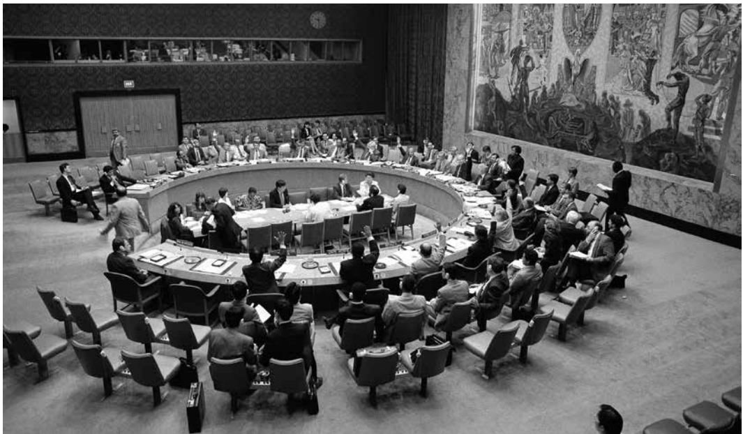
El Consejo de Seguridad establece un tribunal internacional para investigar violaciones de derecho internacional humanitario en la ex Yugoslavia.