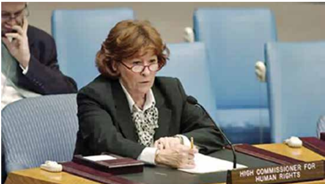
Louise Arbour, Alta Comisionada para los Derechos Humanos (2004-2008), presenta al Consejo de Seguridad las conclusiones de la Comisión Internacional de Investigación sobre Darfur, Sudán (febrero de 2005).

Por su parte, el Consejo de Derechos Humanos respondió, por ejemplo, a las recomendaciones relativas a Côte d'Ivoire (2011) y a la República Árabe Siria (2011) con la designación de expertos independientes, encargados de seguir supervisando la situación de derechos humanos. En otros casos, el Consejo de Derechos Humanos ha creado otros órganos de seguimiento. Por ejemplo, en respuesta al informe sobre Gaza (2009), el Consejo estableció un comité de seguimiento (2010) para "supervisar y evaluar [...] toda actuación interna, legal o de otra índole, que lleven a cabo el Gobierno de Israel y la parte palestina" 97 y en sus sesiones posteriores ha mantenido la situación bajo observación, mediante los informes sobre los progresos realizados. Para dar seguimiento al informe sobre la República Popular Democrática de Corea (2013), el Consejo de Seguridad incorporó la situación de este país a su orden del día, en diciembre de 2014.