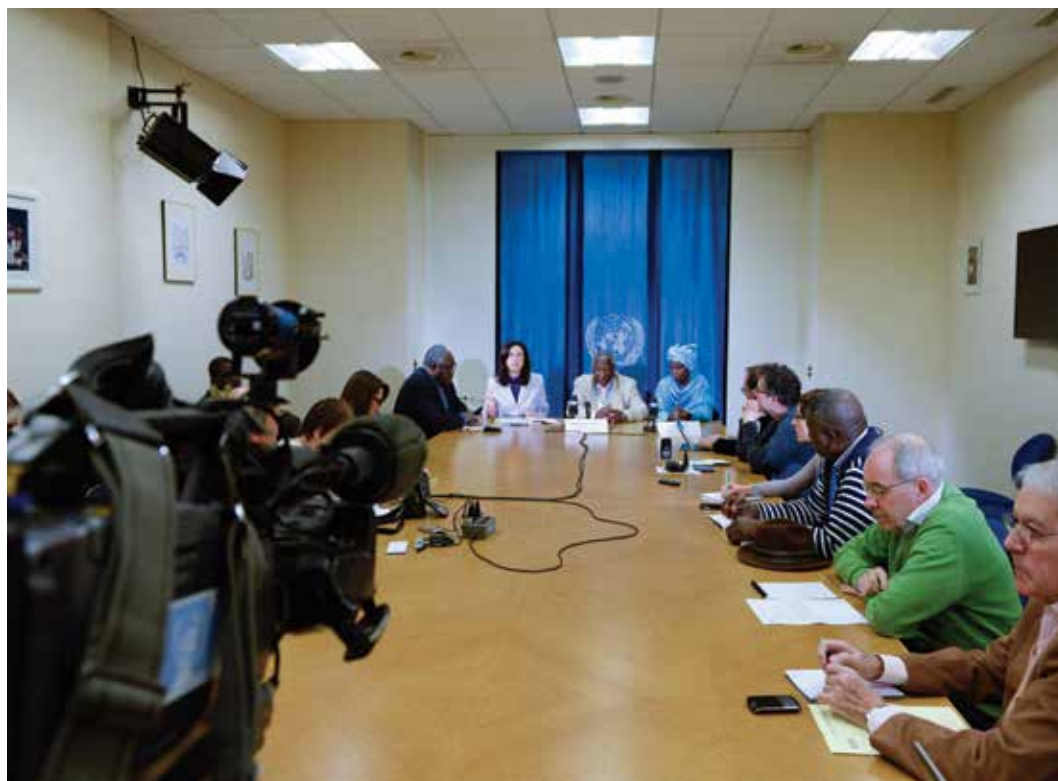
Miembros de la Comisión Internacional de Investigación sobre la República Centroafricana hablan con los medios al término de una misión sobre el terreno.

Las modalidades de presentación pública del informe final han de decidirse en función del mandato específico y de la autoridad mandante. En determinadas situaciones, podría ser apropiado o incluso indispensable dar a conocer el informe o una copia preliminar antes de entregarlo oficialmente a la autoridad mandante. Por ejemplo, los informes que se presentan al Consejo de Derechos Humanos suelen publicarse antes de la presentación oficial. En esos casos, la estrategia de prensa debe tener en cuenta que el informe será de dominio público antes de que la comisión/misión realice su presentación oficial.