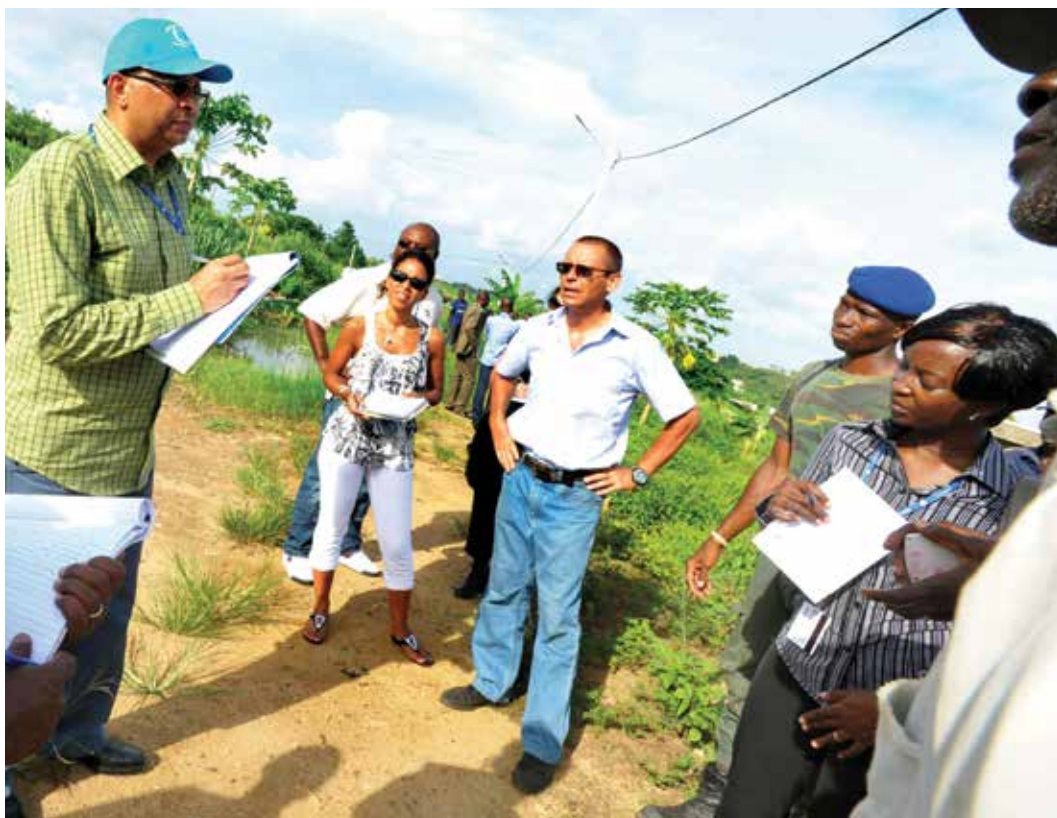
Un equipo de derechos humanos de las Naciones Unidas habla con familiares de las víctimas en Côte d'Ivoire.

llave hasta que la comisión/misión sea disuelta. Toda información archivada en el disco duro de un ordenador deberá estar encriptada y protegida mediante una clave de acceso adicional.