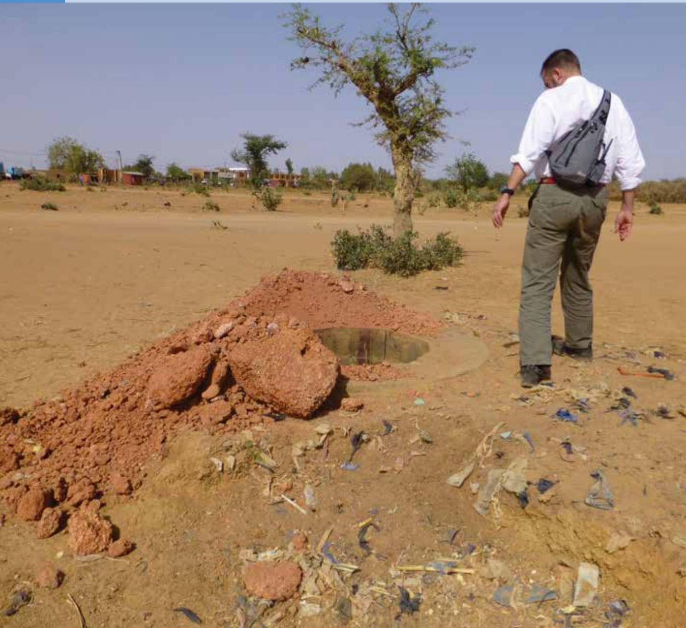
Un miembro de la Misión de Investigación enviada por el ACNUDH a Malí examina un pozo en la ciudad de Sevaré, donde fueron arrojados los cadáveres de algunas víctimas.