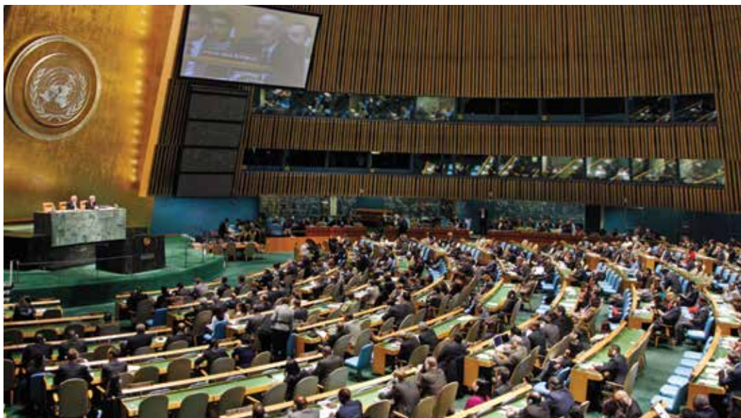
La Asamblea General debate un proyecto de resolución sobre la República Árabe Siria.

En varios casos de gran notoriedad las recomendaciones a la comunidad internacional en materia de investigación, enjuiciamiento y otras modalidades de responsabilidad se han implementado exitosamente. Por ejemplo, tras el primer informe preliminar de la Comisión de Expertos sobre Yugoslavia (1992-1994) 96 , y de conformidad con sus observaciones, el Consejo de Seguridad creó el Tribunal Penal Internacional para la ex Yugoslavia.