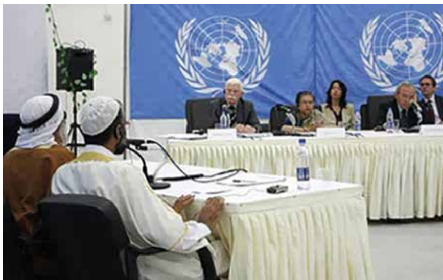
La Misión de Investigación de las Naciones Unidas sobre el conflicto de Gaza celebra una audiencia pública en Gaza para dar a las víctimas, los testigos y los expertos de todas las partes en conflicto la oportunidad de hablar directamente a la comunidad internacional.

En determinados casos, las comisiones/misiones han convocado audiencias públicas para recabar información sobre incidentes o temas que figuraban en su mandato (Gaza (2009) y República Popular Democrática de Corea (2013)). Las audiencias públicas han incrementado significativamente la notoriedad de las investigaciones que las comisiones/misiones llevaron a cabo. Entre otros participantes, a estas audiencias se han presentado: a) víctimas y testigos de presuntas violaciones de derechos humanos y de derecho internacional humanitario; y b) personas expertas en temas que conciernen a los sucesos investigados (por ejemplo, el uso de determinado armamento o la situación de las mujeres). En el contexto de