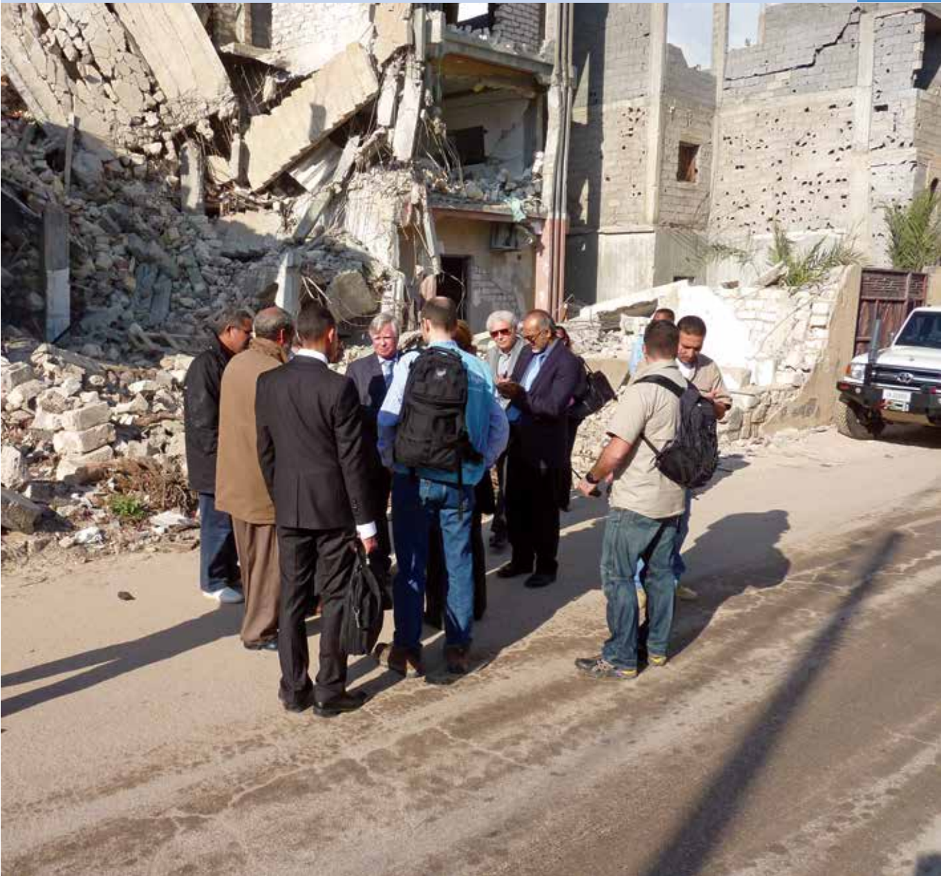
La Comisión de Investigación sobre Libia inspecciona una casa bombardeada en Trípoli.