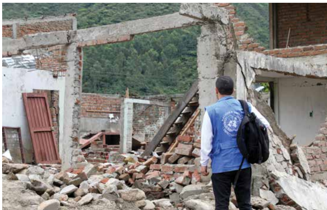
El ACNUDH investiga un ataque guerrillero contra un poblado indígena en Colombia.