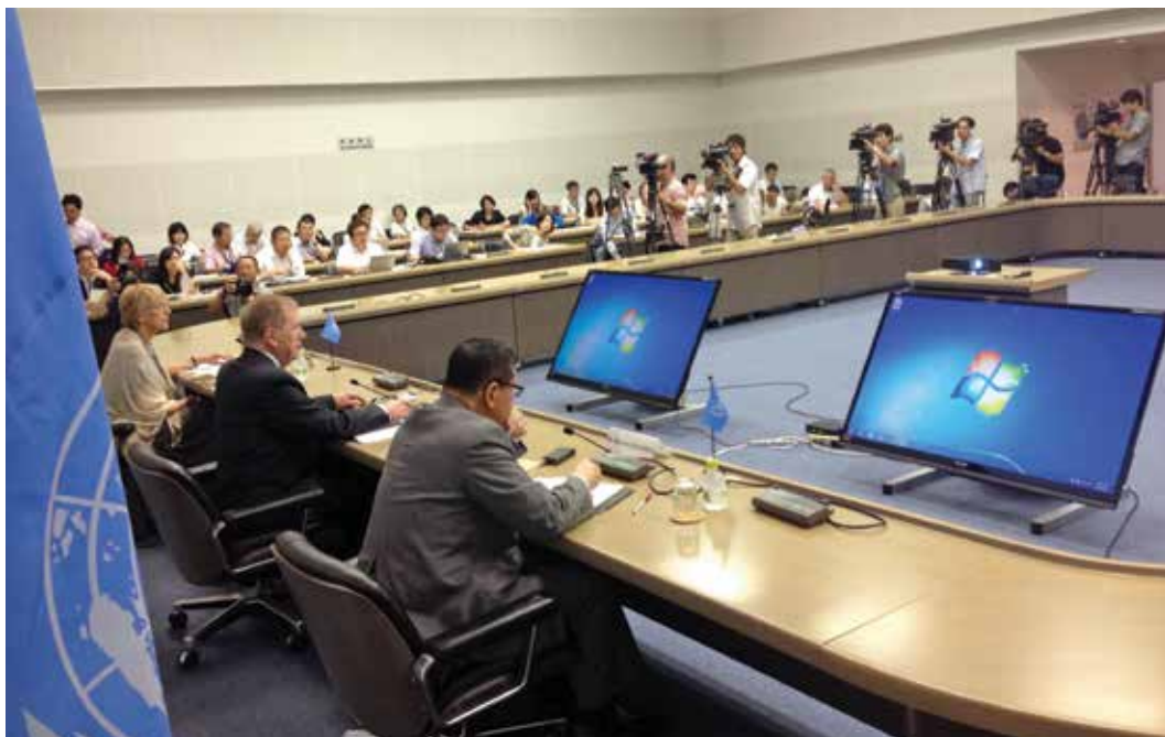
La Comisión de Investigación sobre los Derechos Humanos en la República Popular Democrática de Corea escucha las declaraciones de los testigos durante una audiencia pública celebrada en Tokio.

los mecanismos internacionales de investigación y determinación de los hechos en materia de derechos humanos, las audiencias públicas constituyen un método complementario y no exclusivo de colecta de información. La información que se obtiene en las audiencias puede servir para completar la que la comisión/misión ya ha conseguido mediante otras actividades de investigación, puede constituir información que requiere mayor verificación por parte de la comisión/misión, o puede ser un conjunto de informaciones independientes, que ni suplementa información ya existente ni necesita mayor verificación.