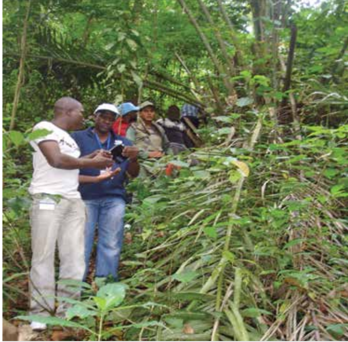
Un equipo de expertos en derechos humanos de la Comisión de Investigación sobre la República Centroafricana visita una zona de Bangui, donde se realizaron ejecuciones extrajudiciales y se descubrió una fosa común en compañía de un sobreviviente.

las comisiones/misiones puedan necesitar la adopción de medidas de precaución adicionales y la búsqueda de información por medios que no entrañen el contacto directo con las fuentes.