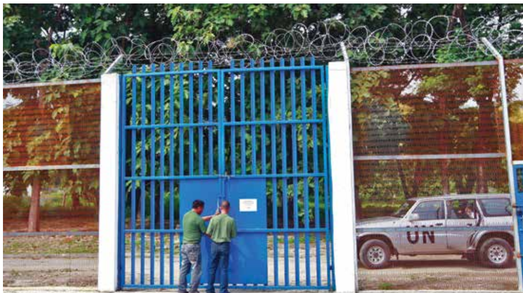
Los miembros de las comisiones de investigación y las misiones de determinación de los hechos necesitan acceso a las víctimas, testigos y fuentes, algunas de las cuales pueden encontrarse en centros de detención.

Desde el principio, los planes de investigación deben integrar los aspectos de género, desde el análisis de las violaciones a investigar y la identificación de las fuentes de información pertinentes, hasta la definición de la metodología, comprendida la previsión de los problemas de género específicos en materia de protección y las medidas para abordarlos.