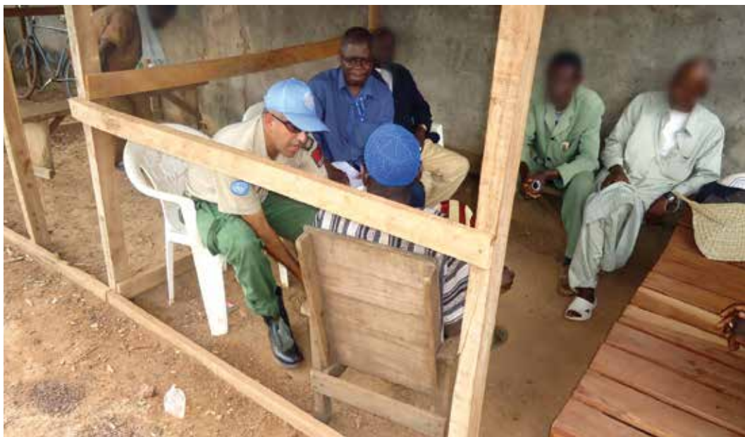
Un investigador discute con un dirigente de la milicia local acerca de presuntas atrocidades cometidas en la zona.

entre otros, por ejemplo, niños y niñas, personas con discapacidad, sobrevivientes de la violencia sexual, la trata de personas o la tortura, miembros de comunidades indígenas, y mujeres de un contexto cultural, social o religioso específico.