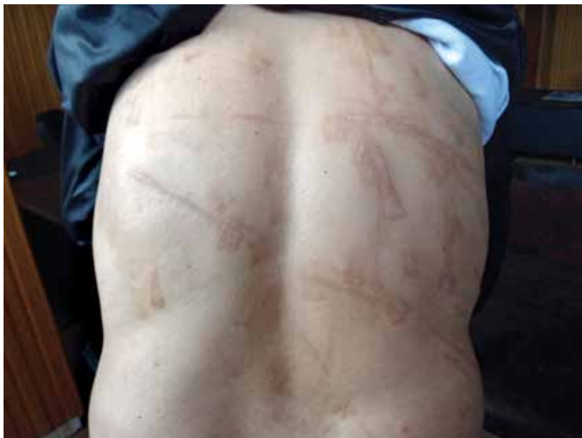
Una víctima de tortura se somete al examen médico forense para una comisión de investigación.

La toma de notas suele ser una tarea que realizan los investigadores e investigadoras de derechos humanos, que también son responsables de su documentación mediante sistemas de gestión de la información adecuados. Si la comisión/misión debe realizar un gran número de reuniones, por ejemplo, con autoridades, podría ser útil que contratara los servicios de redactores de actas literales.