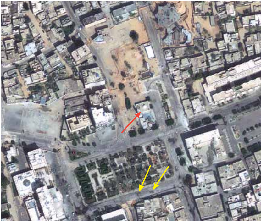
Las flechas rojas señalan una mezquita, identificada mediante imágenes satelitales del 8 de marzo de 2011.