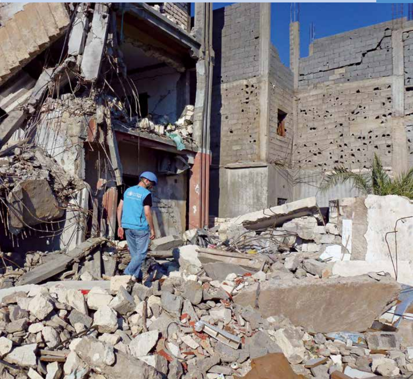
Un oficial de derechos humanos camina entre las ruinas causadas por un bombardeo nocturno en el barrio residencial de Arada (Libia).