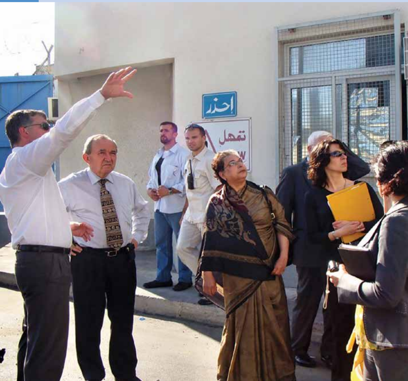
La Misión de Determinación de los Hechos de las Naciones Unidas sobre el Conflicto de Gaza visita un objetivo bombardeado en Gaza.