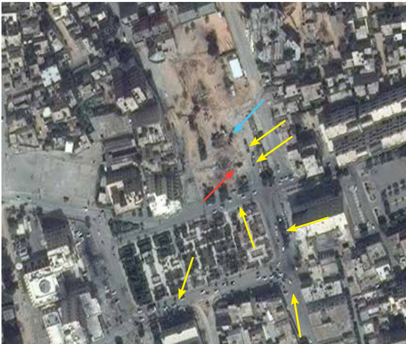
Las flechas rojas señalan la misma mezquita destruida, en las imágenes del 14 de marzo de 2011.