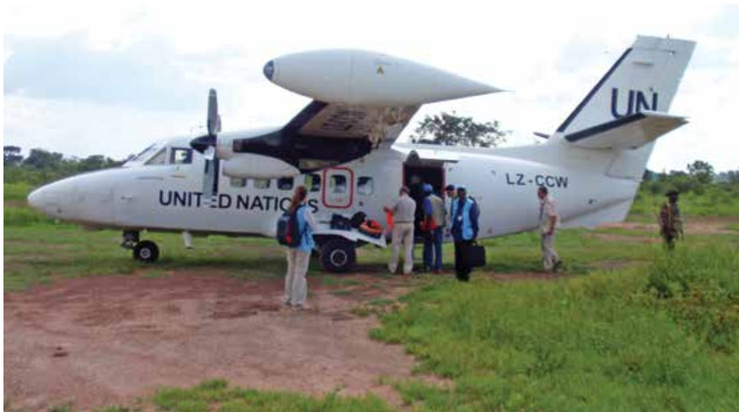
La Misión de Determinación de los Hechos del ACNUDH utiliza los recursos de la Misión de las Naciones Unidas en la República Centroafricana para visitar una zona remota.