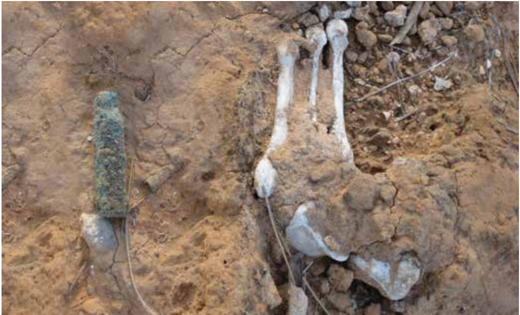
Restos humanos hallados en una fosa común por una comisión de investigación.

dan a conocer en páginas de Internet públicas como YouTube, y tanto videos como fotografías se comparten en redes sociales como Facebook. Los y las activistas comunitarias crean sus propios blogs para intercambiar esos materiales y comentar los sucesos de los que son testigos.