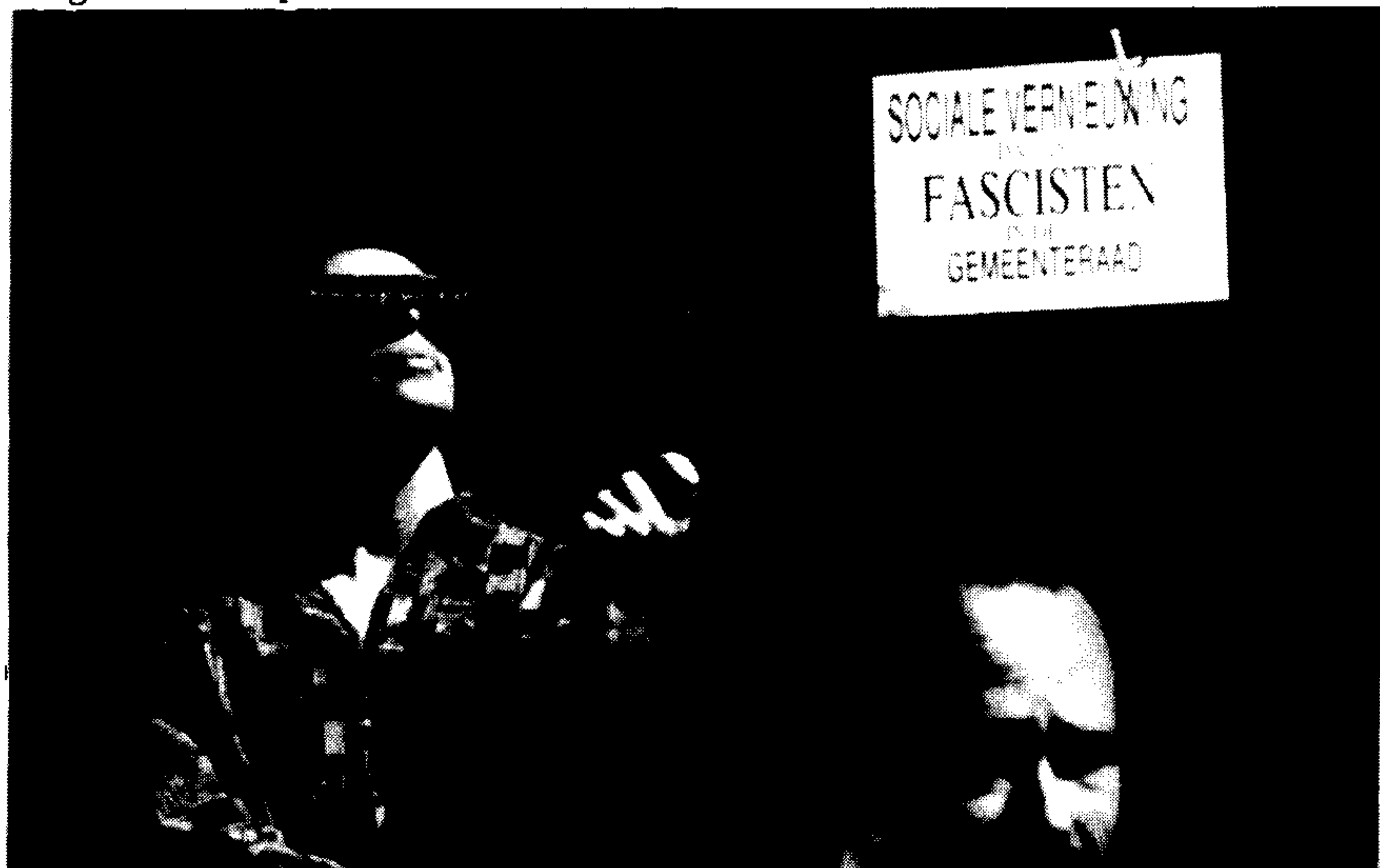
1 mei actie tegen installatie van Fascisten, R'dam.

Het voordeel van het radikaal anti-fascisme zit 'm in de verscheidenheid van de groep die deel uitmaakt van het CNAF en daarmee het brede vermogen van de beweging. Het moeilijkste moet echter nog gebeuren: de verscheidenheid definiëren om de rijkheid ervan te kunnen benutten. Dit alles natuurlijk binnen de anti-fascistische beweging maar in verbinding met andere groepen. Want welke organisatie of beweging kan tegenwoordig nog de pretentie hebben, om in zijn/haar eentje in staat te zijn een politiek alternatief op te bouwen?