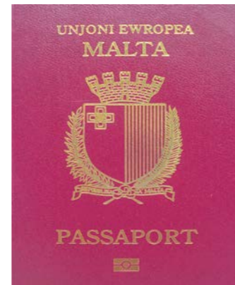
NEUE IDENTITÄT Wie Henley & Partners einen Milliardenmarkt mit Staatsbürgerschaften erschaffen hat. Seite 16