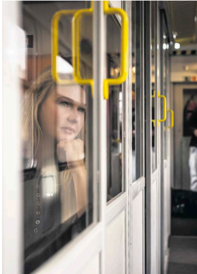
TRAUM VOM ERFOLG Bahn-Konkurrent Locomore muss seinen Betrieb vorübergehend einschränken. Seite 50