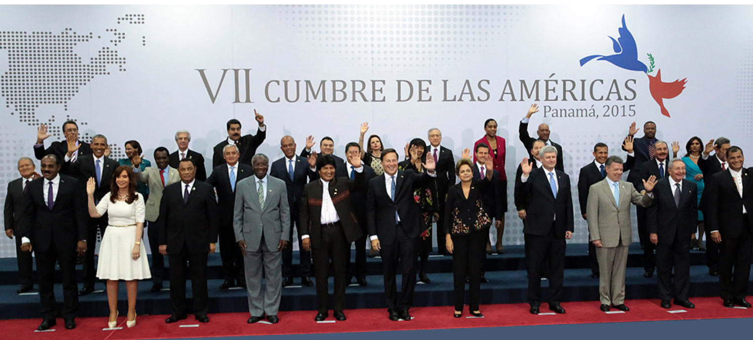
Séptima Cumbre de las Américas Ciudad de Panamá, Panamá, 10-11 de abril de 2015

Presidente Juan Carlos Varela, República de Panamá VII Cumbre de las Américas - 11 de abril de 2015