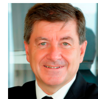
Guy Ryder Organización Internacional del Trabajo