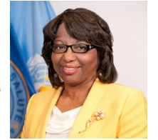
Carissa F. Etienne Organización Panamericana de la Salud