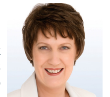
Helen Clark Programas de las Naciones Unidas para el Desarrollo