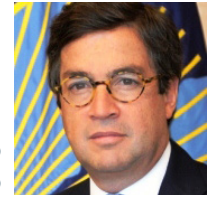
Luis Alberto Moreno Banco Interamericano de Desarrollo