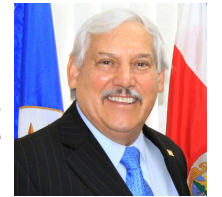
Víctor M. Villalobos Instituto Interamericano de Cooperación para la Agricultura