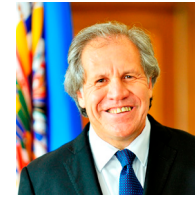
Luis Almagro Lemes Organización de los Estados Americanos