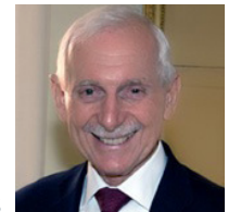
William Lacy Swing Organización Internacional para las Migraciones