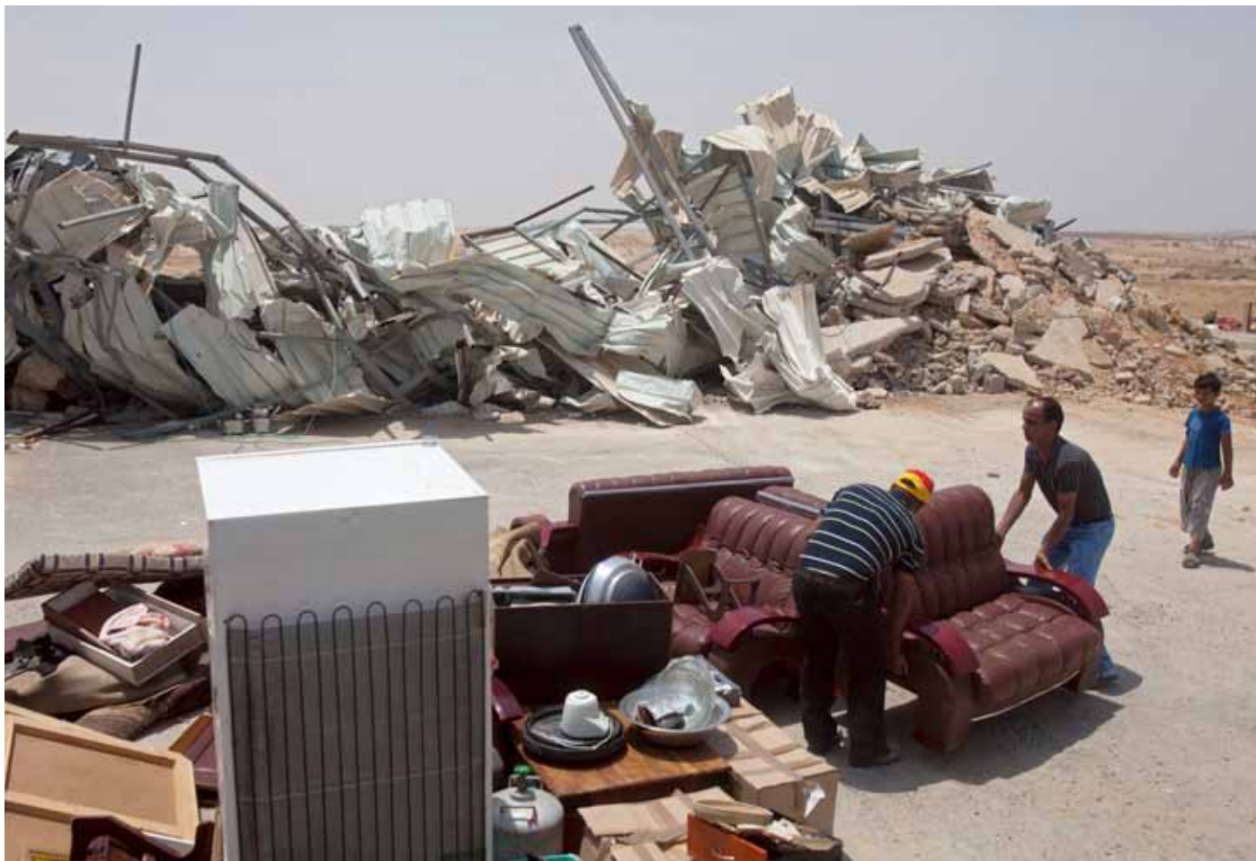
En beduinfamilj i Negevöknen har fått sitt hem demolerat av den israeliska armén

av olika etnicitet och religion. Detta är emellertid något som håller på att förändras. De senaste åren har det israeliska parlamentet stiftat flera lagar som är tydligt riktade mot den palestinska minoriteten. Ett exempel på apartheid i Israel skulle till exempel kunna vara en lag som förbjuder palestinier från Gaza eller Västbanken att få israeliskt medborgarskap eller uppehållstillstånd genom giftermål med en palestinier från Israel.