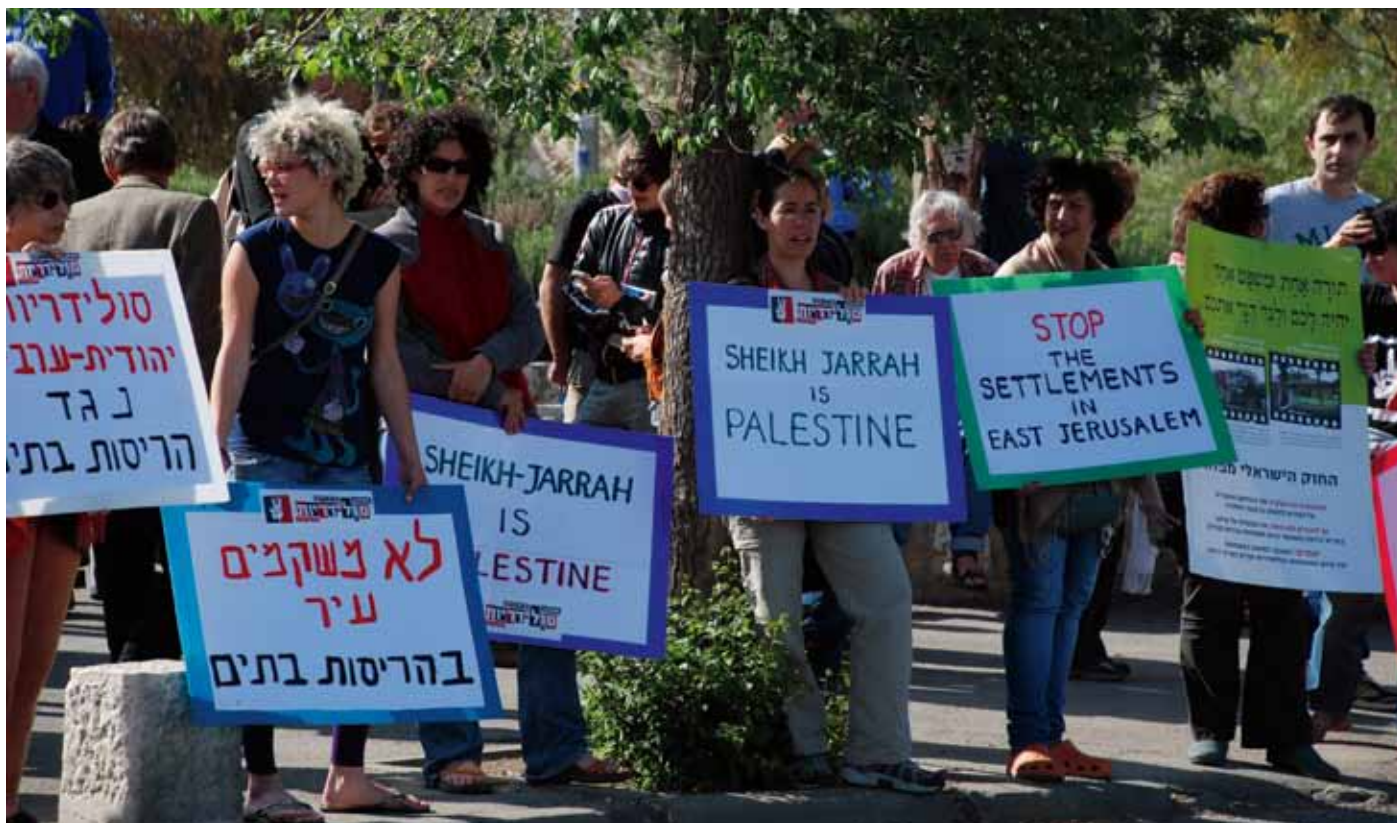
Israeler, palestinier och internationella aktivister demonstrerar varje fredag mot bosättningarna i Östra Jerusalem.

höva passera genom palestinska samhällen eller hindras av vägspärrar.