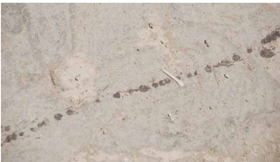
Blodspåret i al-Faria.