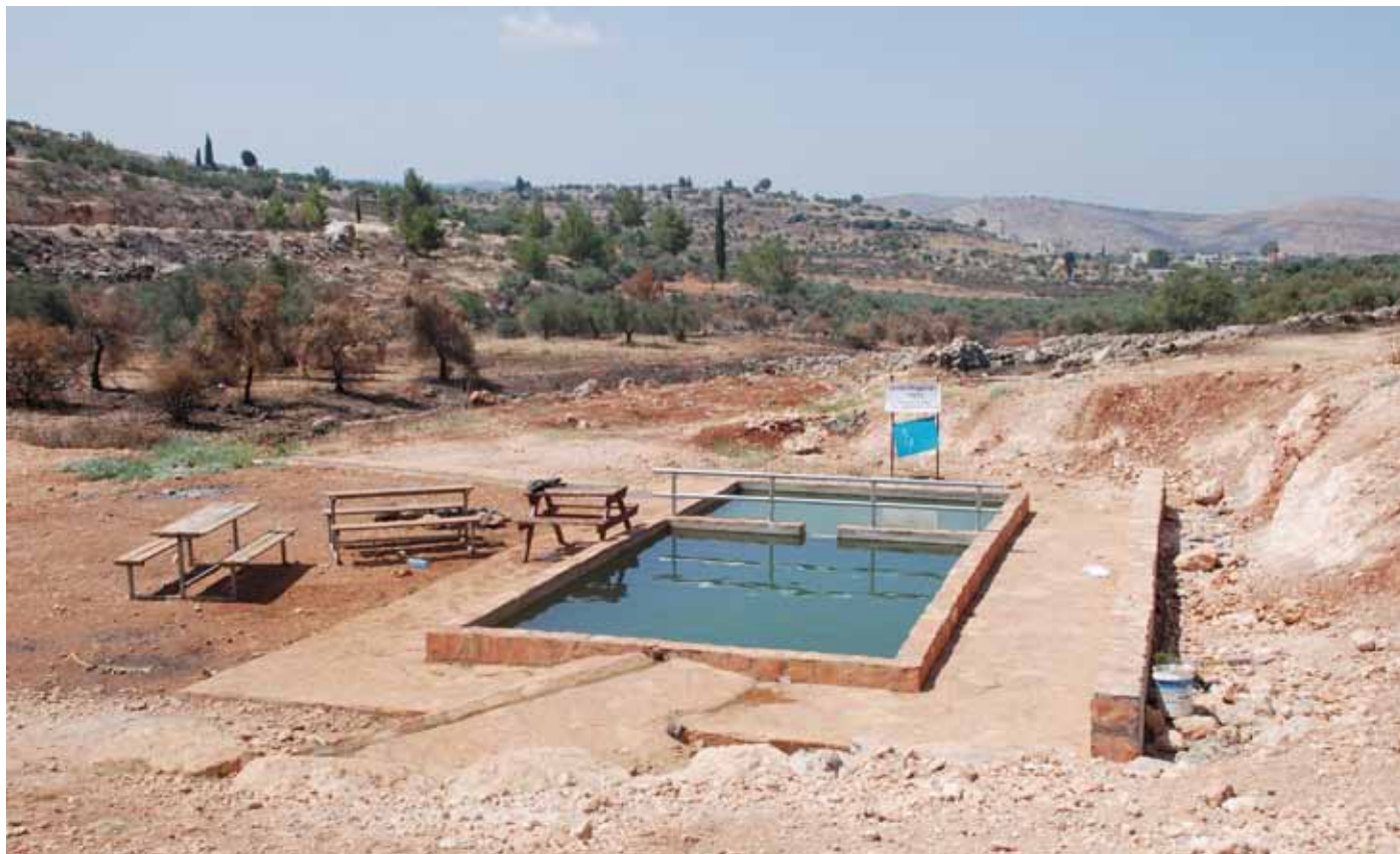
Poolen och picknickområdet i Elon Moreh.

I takt med att bosätternas antal har vuxit har Israel utvecklat ett system av segregering mellan den judiska och palestinska befolkningen på Västbanken. Bosättningarna är till exempel tydligt skilda från de palestinska samhällena, ofta omringade av staket och alltid bevakade av soldater. Palestinier behöver särskilda tillstånd från militären för att besöka en bosättning. Specialbyggda motorvägar gör det möjligt för bosätternas att snabbt ta sig in till israeliska städer utan att be-