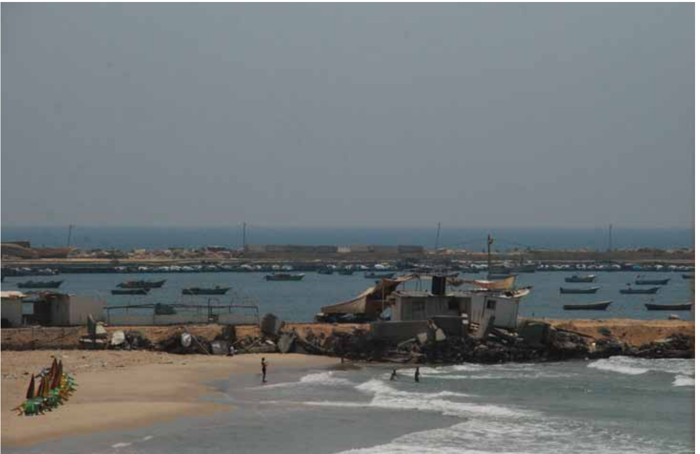
Gaza juli 2011.

unga generationen är så välutbildade att de aldrig kommer att ge upp kampen för rättvisa.