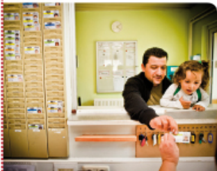
Meer asielaanvragers de laatste maanden

25.000 opvangplaatsen beschikbaar gemaakt over de verspreidde opvangcentra van het Rode Kruis en de individuele opvangcentra. De bezetting van deze opvangcentra is gedaald van 77% in 2011 tot 67% in 2012. Dit bedroeg de