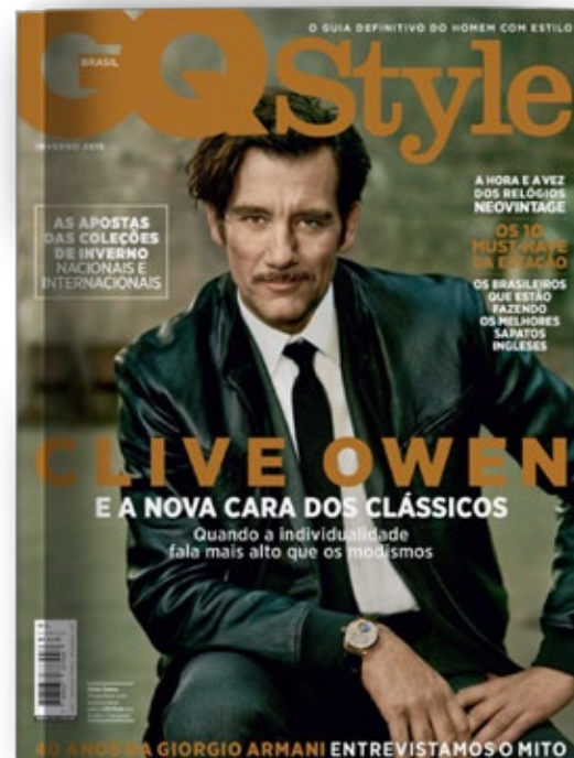
TABELA DE PREÇOS E FORMÁTOS GQ STYLE