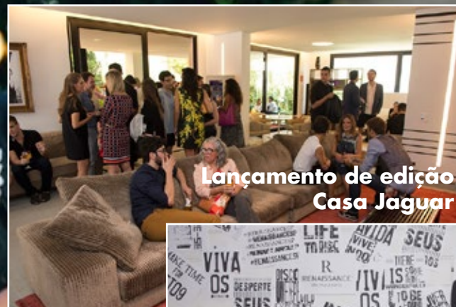
Lançamento de edição Casa Jaguar