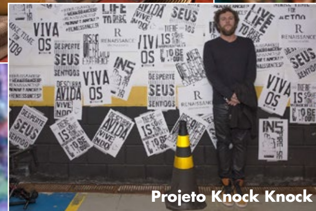
Projeto Knock Knock