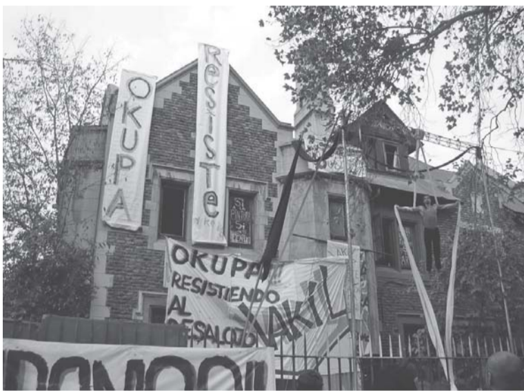
Okupación 550 en Santiago