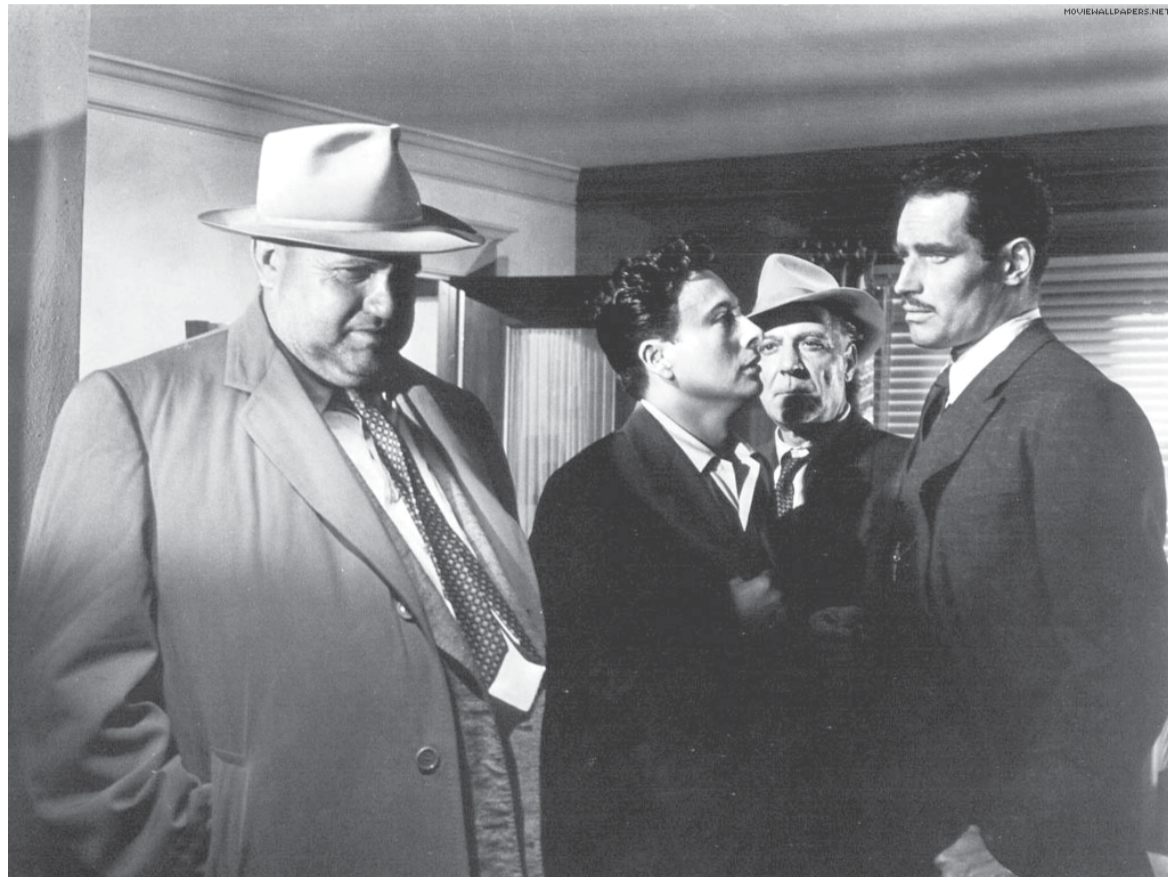
Las cúpulas del partido discuten las próximas candidaturas electorales / «Touch of evil» de Orson Wells

Segundo, los sectores participantes se tradujeron en tres formaciones. En principio, la coalición gubernamental integrada por el PSUV, el PCV y otros entes menores. Luego la oposición formal compuesta por la denominada Mesa de la Unidad Democrática donde se conjugaron los partidos tradicionales (AD y Copei), sus derivados como U.N.T., Primero Justicia y otras organizaciones como Causa R, Proyecto Venezuela, Bandera Roja y pequeños grupos locales y regionales. Después aparecen quienes se arrojan la tercera opción como el PPT, y varias entidades aliadas.