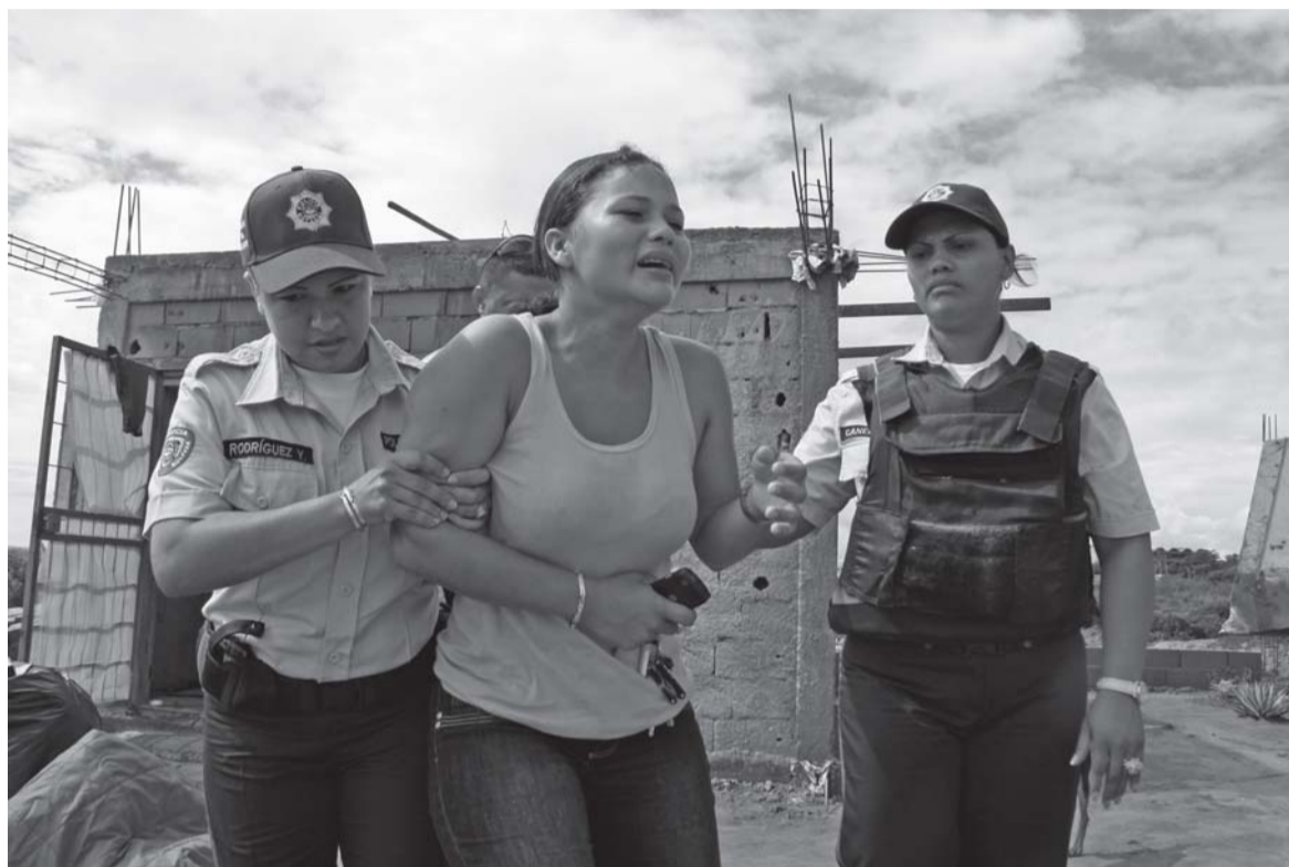
Después de ser desalojada por la fuerza, una mujer es detenida en Puerto Ordáz

mandatario aludía a la crisis de vivienda en los siguientes términos: "si tú caminas por aquí, por la Baralt, por la Lecuna consigues galpones, caserones abandonados muchas veces, edificios abandonados, estacionamientos, depósitos de cauchos (...) Vamos por ellos, vamos por esos terrenos. Tenemos que recuperarlos para construir ahí los edificios, las casas para el pueblo, y no sólo allá lejos, en la montaña". Algunos, desde los medios de comunicación privados hasta una parte de los propios seguidores y seguidoras del presidente, interpretaban estas palabras como un estímulo a que las personas sin techo ocuparan terrenos e inmuebles abandonados para satisfacer su derecho a una vivienda. Contrariamente, en otras alocuciones el jefe de Estado ha sido claro sobre el protagonismo popular en el tema: "La persona que invada una vivienda o un grupo de personas que invadan un conjunto de viviendas, están haciendo un acto ilegal, y por esa acción pierden el derecho de atención prioritaria", declaró en su maratónico número 310. En esa misma ocasión opinó sobre quienes ejercen su derecho a la manifestación para exigir casa: "nadie tiene derecho a obstaculizar el tránsito vehicular, el Gobierno responderá por los proyectos habitacionales en desarrollo". Lo cierto es que año tras año el gobierno no llega al 50% de las casas que prometió construir.