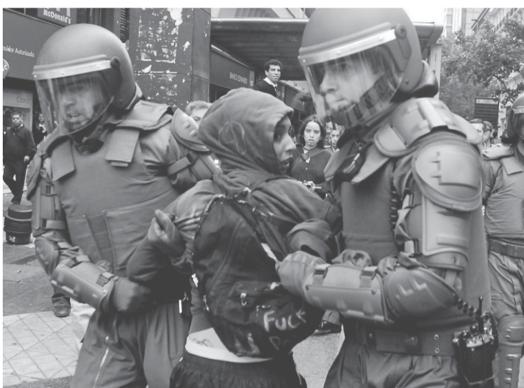
Manifestante anarquista es detenida en Santiago