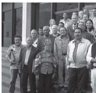
Arriba: Casa de la Mujer «Juana la Avanzadora», Maracay. Izquierda: Marcha GLBT Caracas 2009. Derecha: Activistas demandan a las empresas mixtas ante el TSI

colectivo (se estima que en 1958 entre 25 y 30 % de los electores eran militantes registrados de las cuatro formaciones políticas principales) y ya habían impuesto sujeción a los movimientos sociales; ahora podían fortalecer esa hegemonía con el clientelismo: reparto desde el Estado de cargos, favores, recursos y, en especial, promesas, entre quienes de otro modo serían ganados para conflictos y protestas. Tal mecanismo de control político funcionará con bastante éxito hasta la década de 1980.