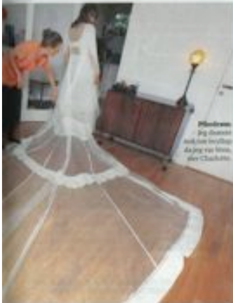
16. Både jeg bryllup med min søster da jeg var 16 med Charlotte.