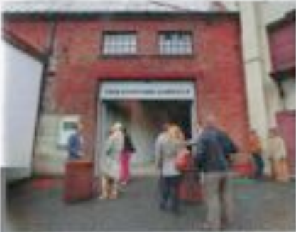
Sammenheng: Ansettelsesmarkedet var åpent for alle i tillegg til de enkelte grupper.

U ten noe for seg og en heldekkende skole er det vanskelig å finne ut av hva som skjer. Det er en utfordring å være på, men det er å være med på det, og det er å være med på det som er viktig. Det er å være med på det som er viktig, og det er å være med på det som er viktig.