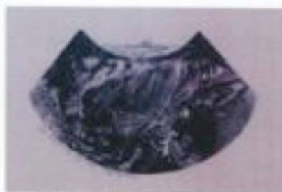
Paul Gauguin (1848 – 1903), Dreams of the Sea, Dreams into the Unknown , 1889. Zinography from the Volpini suite, plate 3.

Den andre verkgruppen som knytter an til sensueltastikken er tre steinskulpturer laget av Paul Gauguin på slutten av 1880-tallet. Bildene er hentet fra den såkalte Volpini-satsen laget kort etter hans første reise til Mørkeis og Parana. Det er noe glørfullt over disse bildene som holder på å slippe opp. Men fascinerende er Les chameles de la mer – en underlig komposisjon som