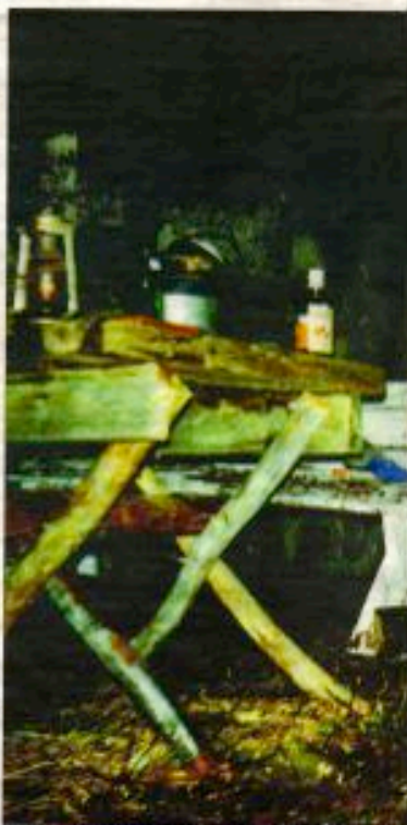
WOLFGANG BRUNS: Høsten fra Regener, Skulptur 1969, C-print 100 x 125 cm

Wolfgang Bruns (1928-1998) var en tysk kunstmaler, grafiker og arkitekt. Han var medlem av den tyske kunstbevegelsen 'Gruppe 57' og var en av de mest innflytelsesrike kunstnerne i etterkrigsperioden. Hans verk er preget av en sterk geometrisk og abstrakt stil, og han er kjent for sine utstillingsoppsett og sine arkitektoniske tegninger. I denne anmeldelsen diskuteres hans kunstneriske og arkitektoniske bidrag til den tyske etterkrigs-kulturen.