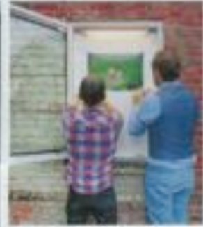
Sammenheng: Det er for eksempel i skoleåret 2012-13 at det ble etablert et samarbeid mellom skole og foreldre.