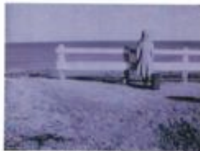
George Kuchar (b. 1942), Corruption of the Damned , 1963. (B&W 31 Min.)