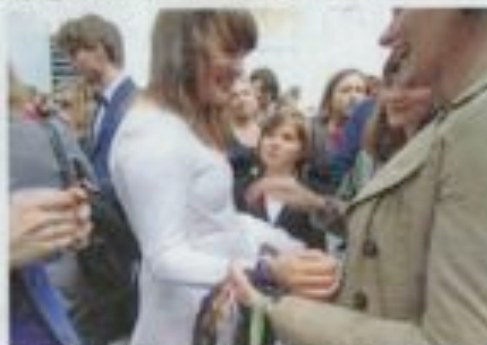
Sammenheng: Det er for eksempel i skoleåret 2012-13 at det ble etablert et samarbeid mellom skole og foreldre.