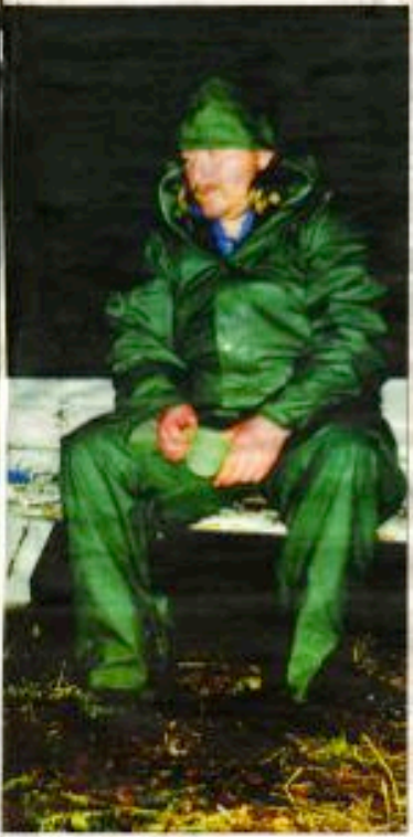
2001, av Tafelberg Mønstre