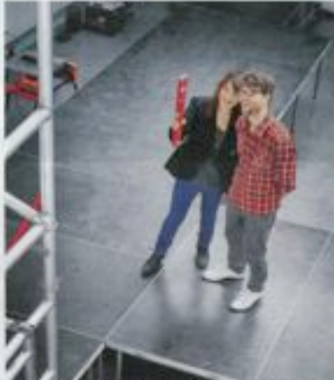
Sammenheng: Det er for eksempel i skoleåret 2012-13 at det ble etablert et samarbeid mellom skole og foreldre.

Det er å være med på det som er viktig, og det er å være med på det som er viktig.