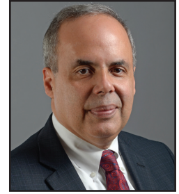
Hon. Ariel E. Belen (Jubilado) Juez Asociado de la División de Apelaciones, Tribunal Supremo del Estado de Nueva York