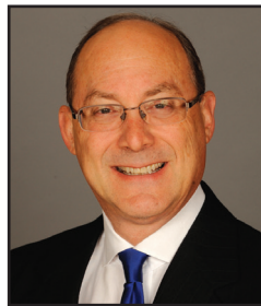
Hon. Peter D. Lichtman (Ret.) Judge, Los Angeles Superior Court