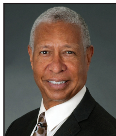
Hon. Ricardo M. Urbina (Ret.) Judge, U.S. District Court, District of Columbia