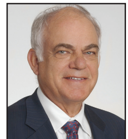
Hon. Konrad von Finckenstein, Q.C. Justice, Federal Court of Canada