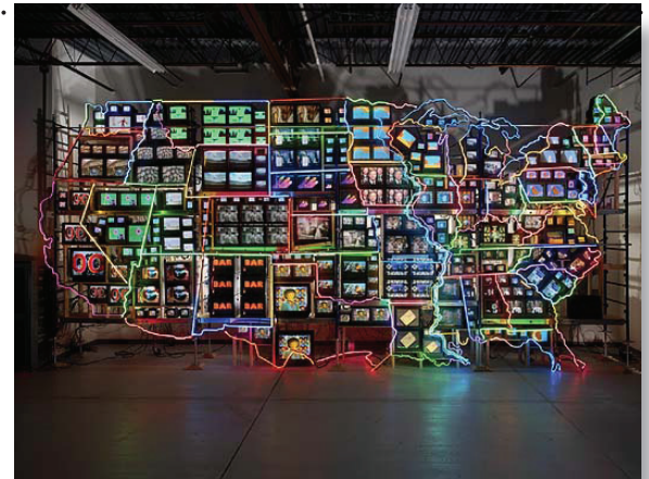
Regalo del artista ©1995, Nam June Paik

Electronic Superhighway: Continental U.S., Alaska, Hawaii de Nam June Paik, 1997 ▶ Museo Smithsonian de Arte Americano, Galería Lincoln, 3 er piso — Aunque nació en Corea, Nam June Paik creó Electronic Superhighway en honor a su patria adoptiva. Paik eligió distintos videos para representar su impresión de cada estado. ▶ ¿Cómo representó Paik tu estado? ¿Cómo le transmitirías a alguien que acaba de llegar a este país qué es ser estadounidense?