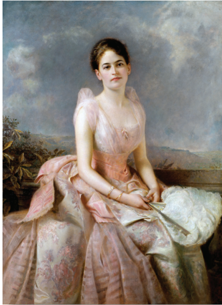
Regalo de las Girl Scouts de los Estados Unidos de América

Visita cinco museos que formen parte de la Institución Smithsonian para celebrar los 100 años de las Girl Scouts.