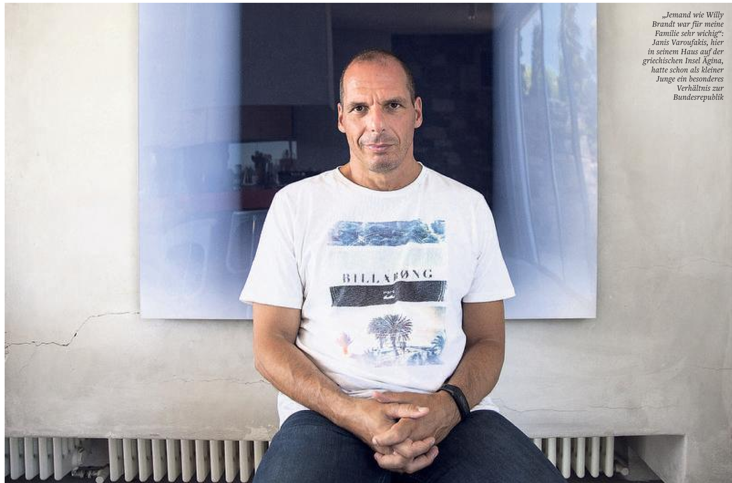
„Jemand wie Willy Brandt war für meine Familie sehr wichtig“. Janis Varoufakis, hier in seinem Haus auf der griechischen Insel Ägina, hatte schon als kleiner Junge ein besonderes Verhältnis zur Bundesrepublik

WELT AM SONNTAG | NR. 33 | 14. AUGUST 2016 | SEITE 33