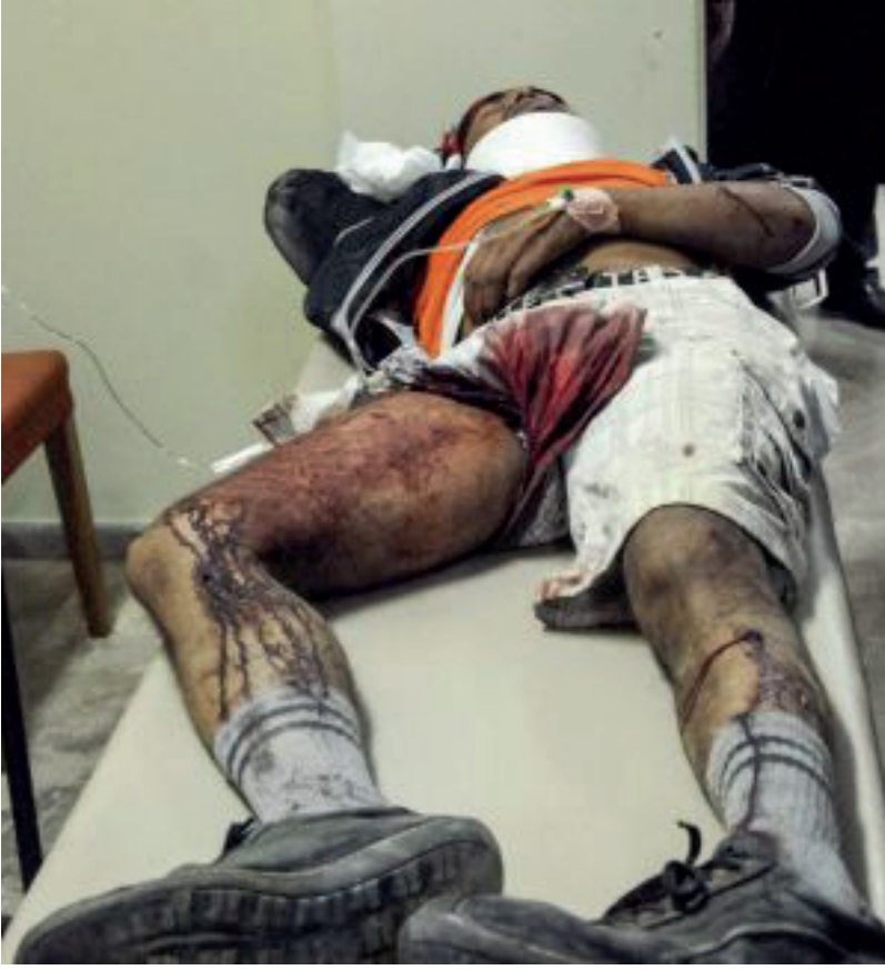
Anexo 3: Imágenes de inmigrantes herido