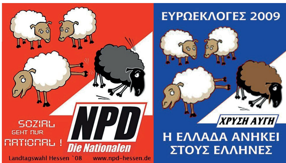
Partido nazi alemán (NPD)

Material de la campaña preelectoral para las elecciones europeas de 2009: