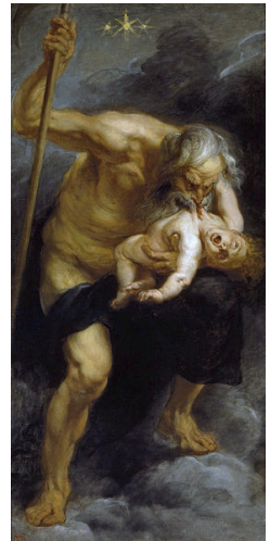
Rubens: Saturno (1635-1637)