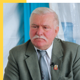
MEDEF, CC BY SA 2.0