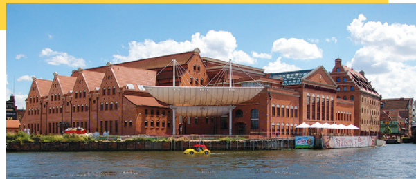
Lukasz Golowanow, CC BY SA 3.0