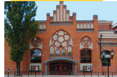
Lukasz Golowanow, CC BY SA 3.0

あちこちに見られたコンファレンスTシャツには、「フリー・シティのフリー・ナレッジ (Free Knowledge in the City of Freedom)」というモットーが掲げられ、1980年代にレフ・ワレサが率いた「連帯」運動が共産主義支配者たちに抵抗したグダニスクの歴史とウィキメディアの価値観を関連付けました。レフ氏は、自分でもウィキペディアを頻繁に利用することを述べる、挨拶状をウィキマニア参加者に送っています。