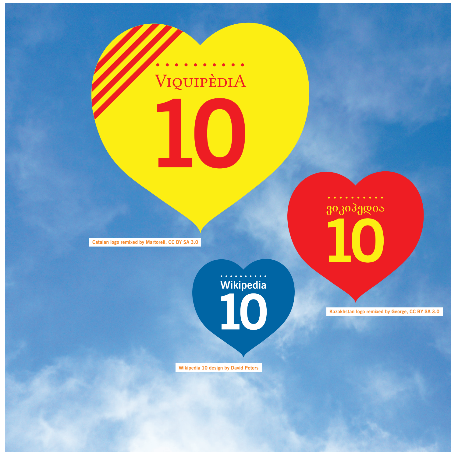
David Peters, CC BY SA 3.0