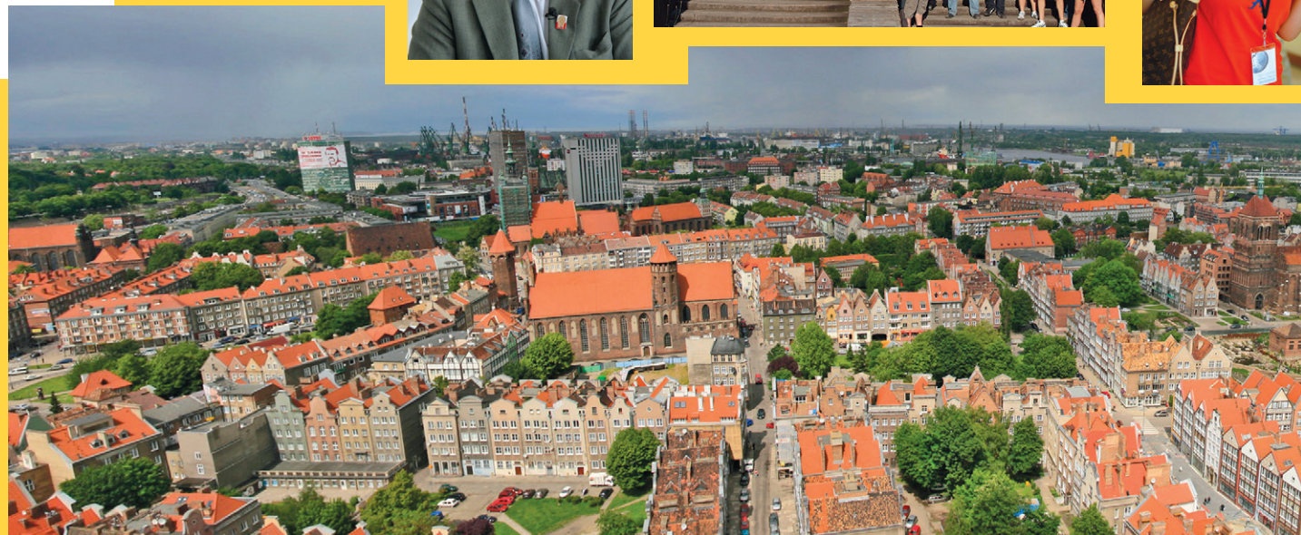
Michał Stupczewski (www.slupczewski.pl), CC BY SA 3.0