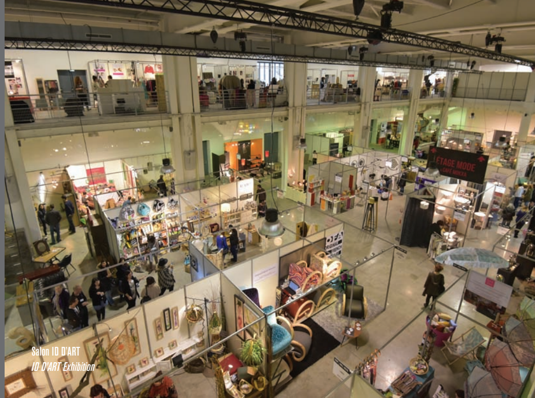
Salon ID D'ART ID D'ART Exhibition