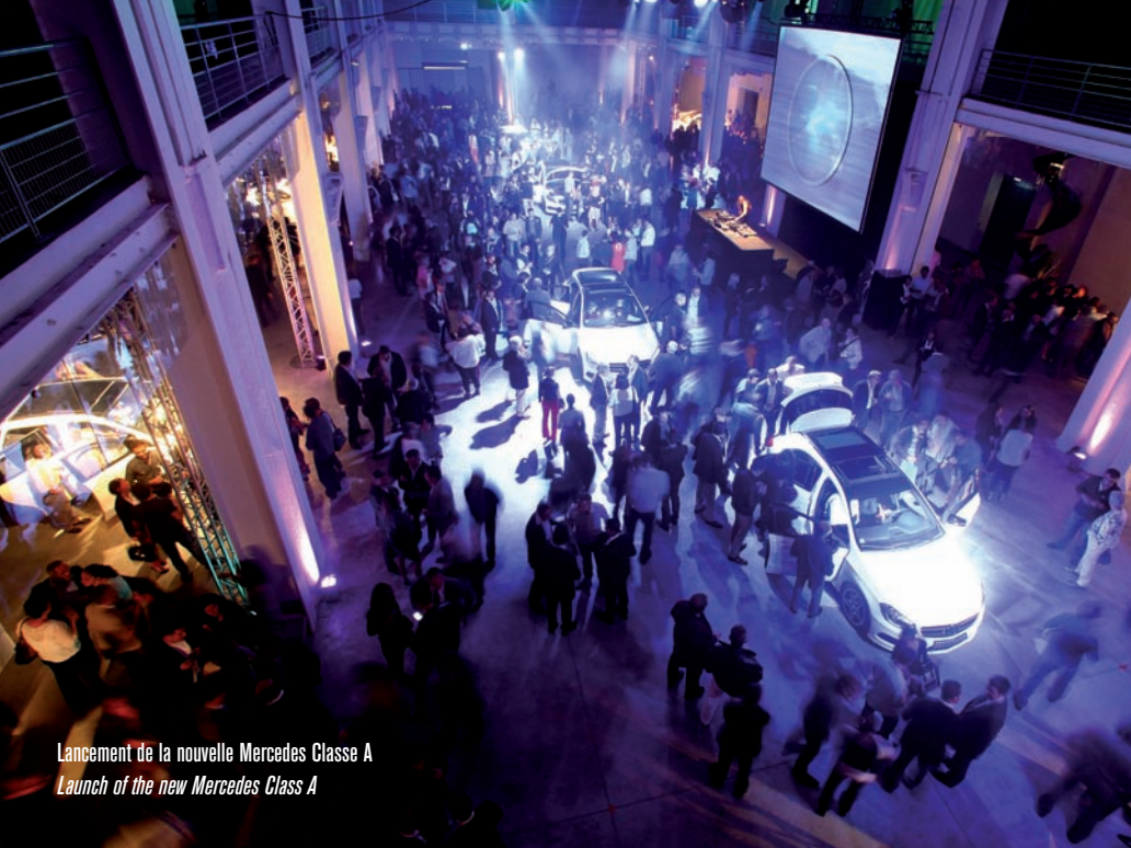
Lancement de la nouvelle Mercedes Classe A Launch of the new Mercedes Class A