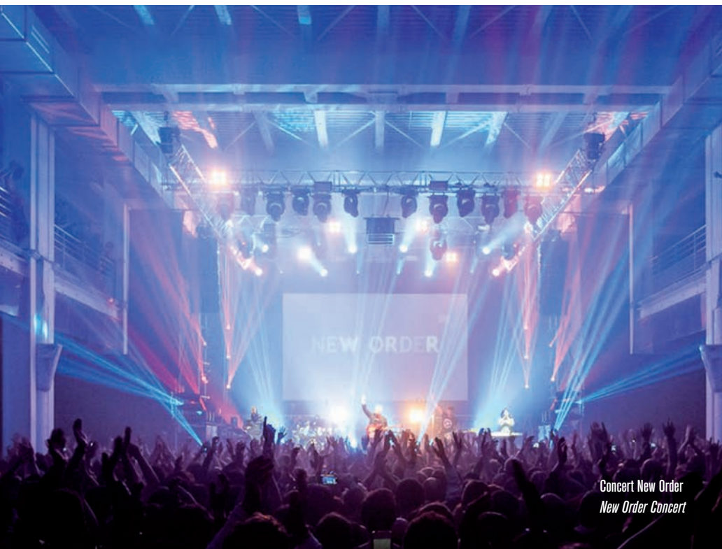
Concert New Order New Order Concert