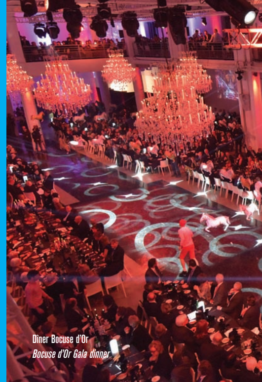
Dîner Bocuse d'Or Bocuse d'Or Gala dinner