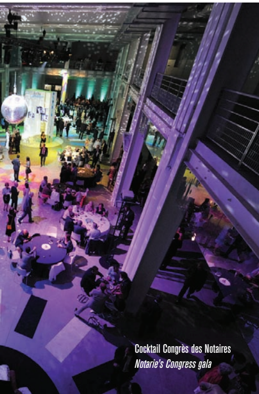
Cocktail Congrès des Notaires Notarie's Congress gala