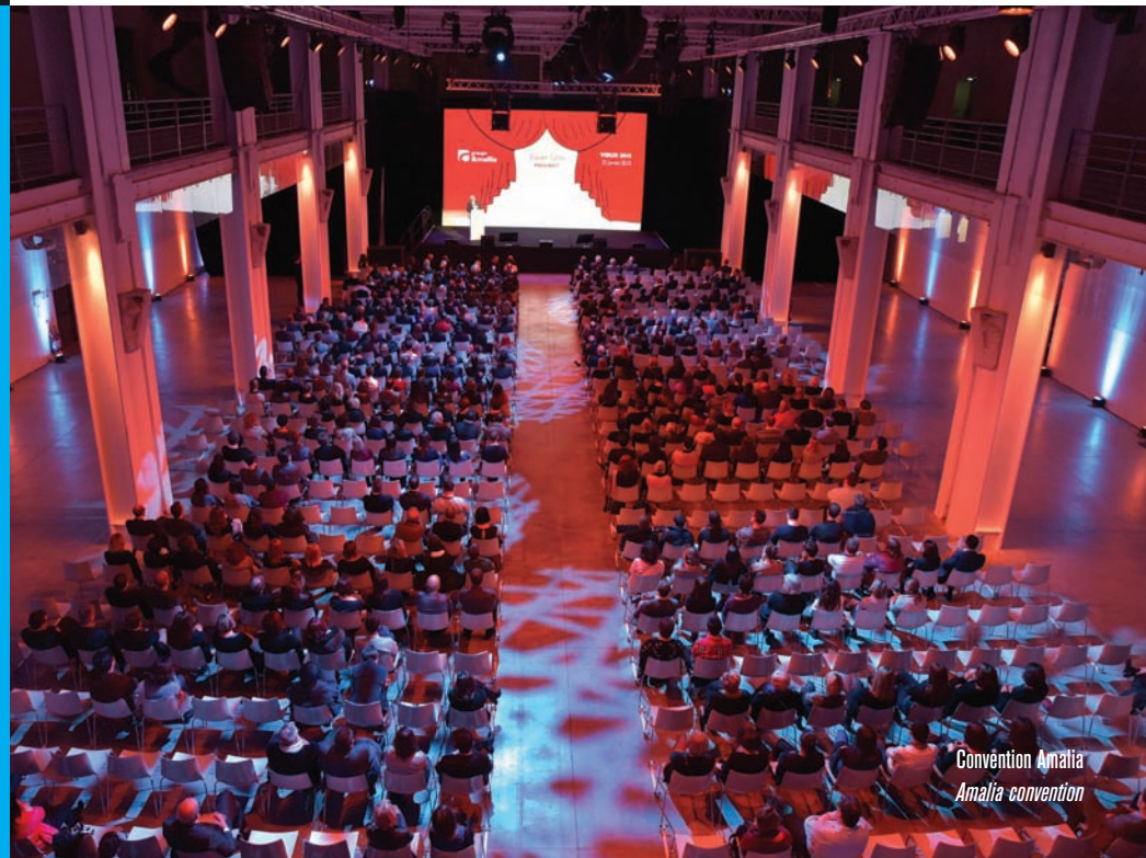
Convention Amalia Amalia convention