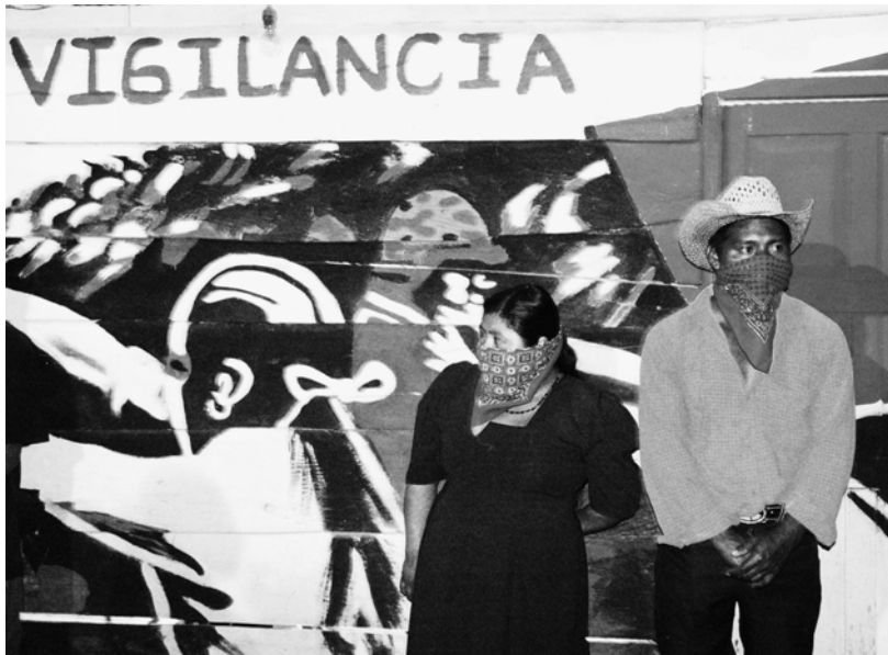
Fotografía tomada en el Caracol de La Garrucha.