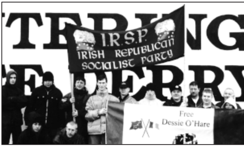
Några kamrater samlade vid Free Derry Corner