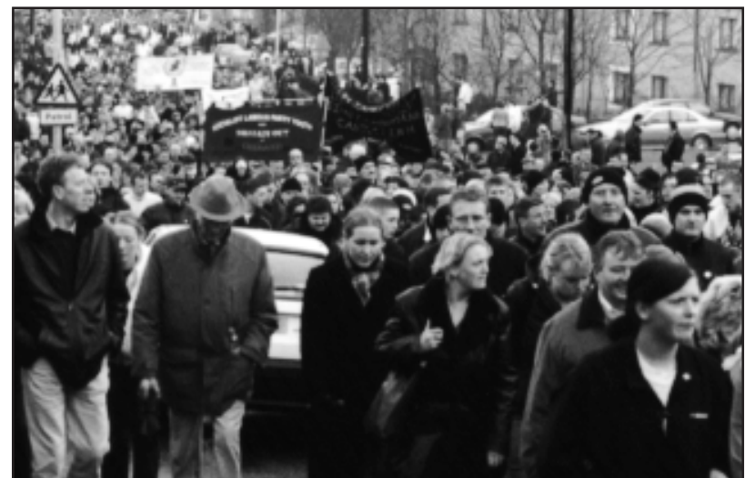
En massiv uppslutning trots det regniga vädret!

Söndagen den tredje februari hålls så den stora minnesmarschen med samling vid Creggan Shops. Det är svårt att få en överblick över antalet deltagare, men enligt arrangörerna talas det om att det är den största demonstrationen i Derrys historia. 40 000 är en siffra som omnämns och som även anammas av tidningarna. Sakta vandrar vi genom de slitna arbetarkvarteren, gata upp och gata ner kantade av människor. Svarta sorgflaggor har hängts ut från fönstren i många