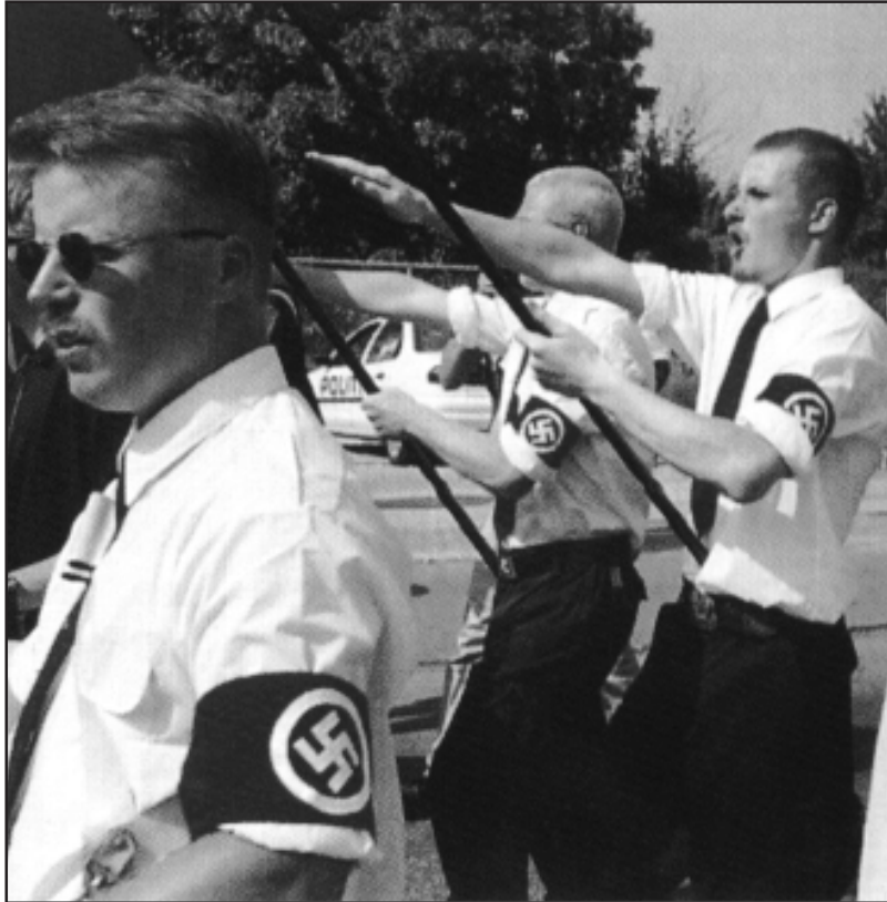
Fascisterna marscherade rätt in i riksdagen

Fogh Rasmussen själv menar att Dansk folkeparti varit en mycket stabil parlamentarisk partner och att deras samarbete fungerat alldeles utmärkt. Efter att ha mött kompakt missnöje från omvärlden backade reger-