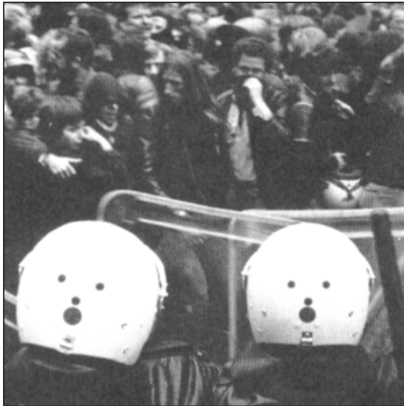
Poliser på väg att spöa sina första demonstranter!

och på andra vis uppträdde inkorrekt. Vad poliserna än har sagt, hur de än har misstagit sig i fråga av de tilltalades kläder i gärningsögonblicket, har tingsrätten konstaterat att polisen har gjort ett "balanserat och tillförlitligt intryck". Man har hellre valt att fälla än att fria de misstänkta. Detta har varit extra tydligt under åtalerna mot den så kallade "sambandscentralen". Hovrätten anser här att det inte går att bevisa att de sms-meddelanden som skickats verkligen spelade den direkta roll i upploppen som åklagaren har velat hävda. Istället dömer man samtliga kollektivt för medhjälp till våldsamt upplopp. Straffet för detta brott sattes till 2 års fängelse vilket är ovanligt högt för denna typ av brott. Hovrätten hävdar att "även om en viss del av informationen var tillgänglig också via andra kanaler, exempelvis tidningars webbsidor, medverkade denna grupp till att snabbt sprida informationen. Det måste förutsättas att gruppen genom detta agerande spelade en betydelsefull roll vid upploppens genomförande". Samtidigt som sms-en tonas ned så förutsätts hela organisationsstrukturen ha haft syftet att det ska ske angrepp mot polisen. Men det presenteras aldrig några bevis för det, utan man skriver bara att "det kan