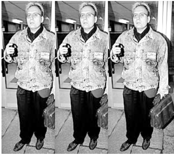
Det finns på tok för många kristdemokrater