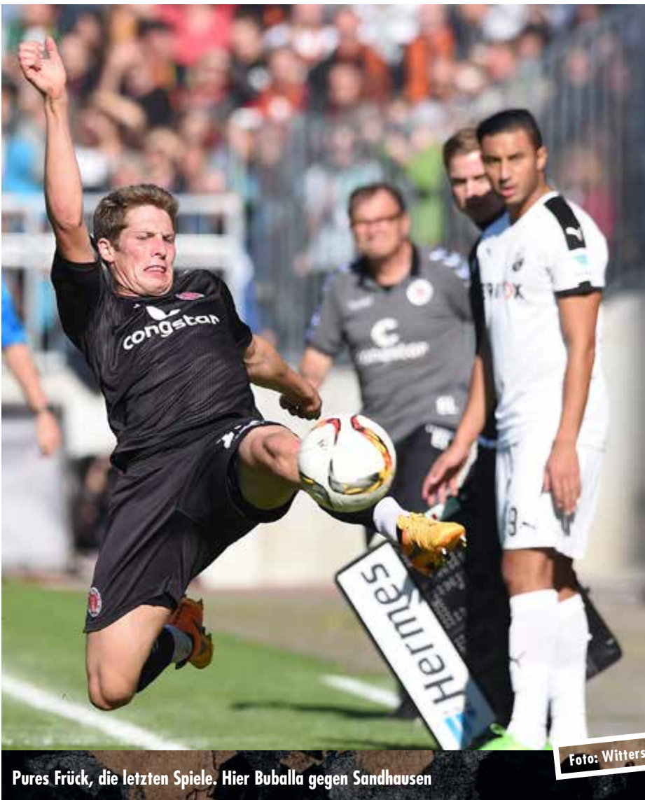
Pures Frück, die letzten Spiele. Hier Buballa gegen Sandhausen