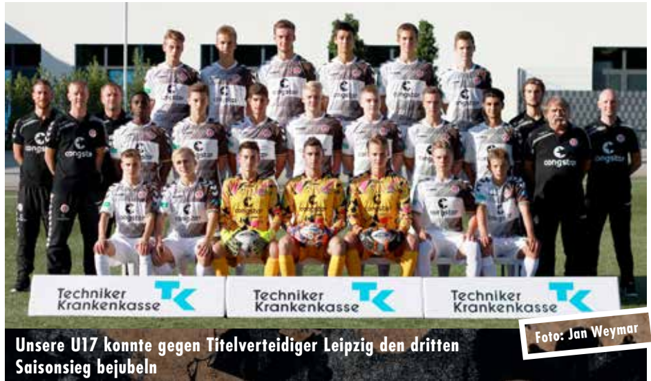
Unsere U17 konnte gegen Titelverteidiger Leipzig den dritten Saisonsieg bejubeln