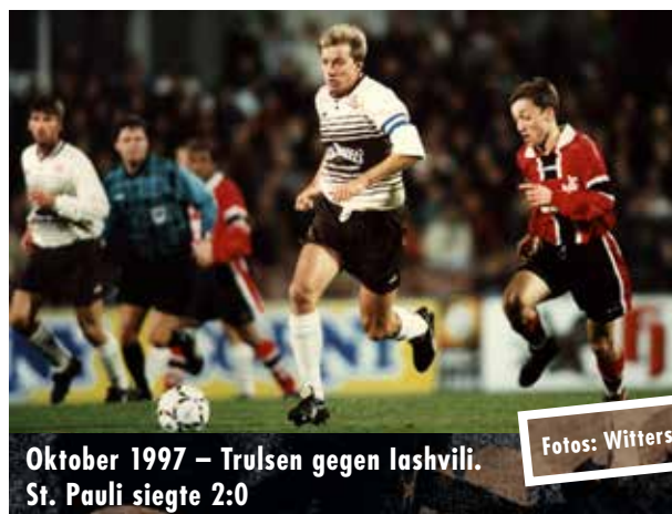
Oktober 1997 – Trulsen gegen Iashvili. St. Pauli siegte 2:0