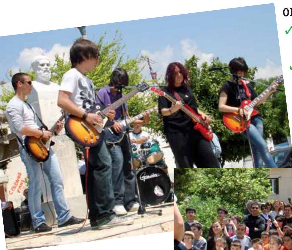
ΑΠΟ ΤΗΝ ΚΙΝΗΤΟΠΟΙΗΣΗ - ΣΥΝΑΥΛΙΑ ΣΤΙΣ 9 ΜΑΪΟΥ