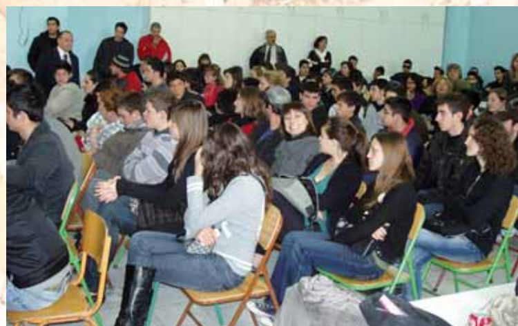
Γεμάτο το αμφιθέατρο του 3ου ΕΠΑΛ από μαθητές γονιούς, καλεσμένους για την αντιρατσιστική εκδήλωση. Στο τέλος με τις ομάδες στα τραπέζια δουλειάς ακούστηκαν πολλοί προβληματισμοί και έγιναν πολύ καλές τοποθετήσεις.