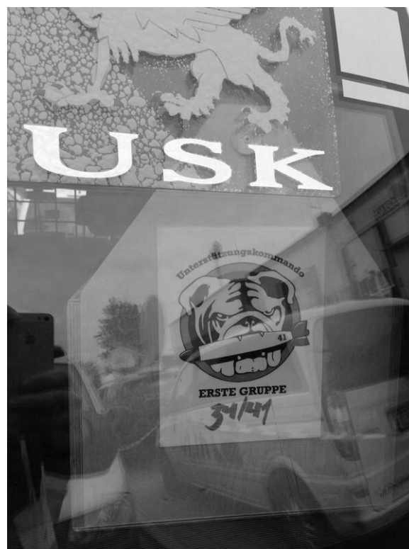
Bedrohliches Selbstbild: Selbstentworfenes Logo des USK Würzburg (2014)

Der Autor ist Mitglied der GJ Göttingen, hat an der Blockade teilgenommen und dabei Pfeffersprayeinsatz und Schmerzgriffe erfahren. Der Beitrag basiert auf einem kurz nach dem Ereignis angefertigten Gedächtnisprotokoll.