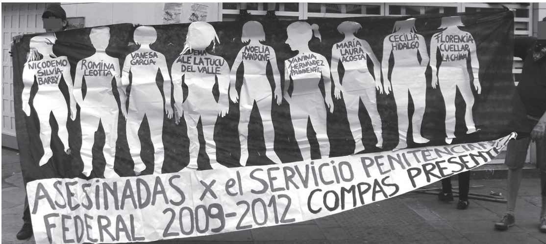
Escrache al SPF, diciembre de 2015.