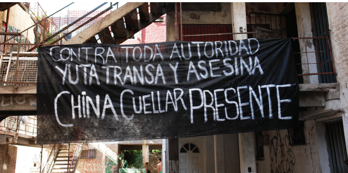
Desde Fuerte Apache, La China Presente