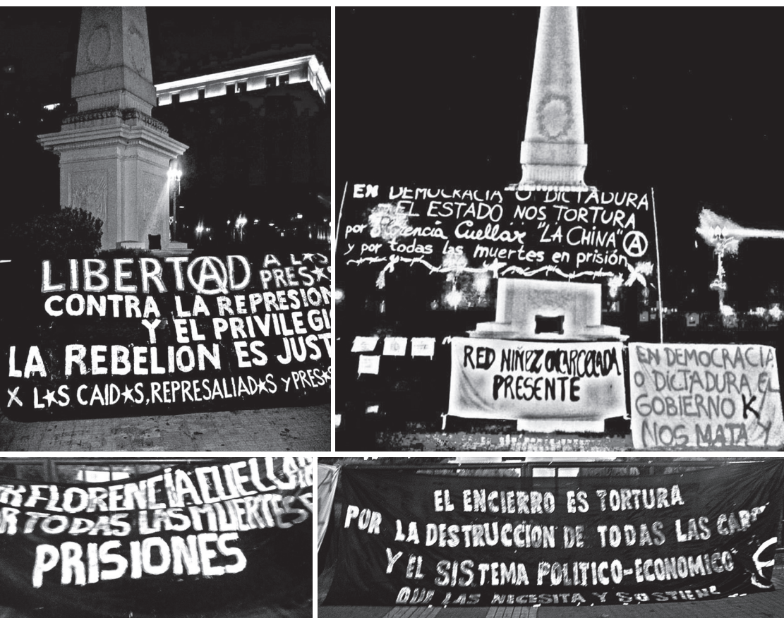
Navidad 2013 en Plaza de Mayo en solidaridad con lxs detenidxs.

En 2014 se realizaron nuevos escraches y otro festival anti-carcelario en el mes de diciembre, nuevamente en plaza Once. En 2015 continuaron los escraches y se hizo el tercer festival anti-carcelario, esta vez en la Asam-blea de Villa Urquiza, con la presencia de compañeras y familiares de la China, familiares víctimas de otras causas de impunidad, y diferentes grupos de afinidad y compañerxs.