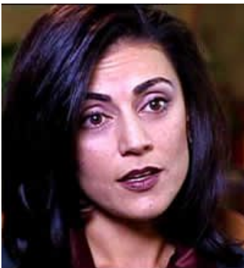
Sibel D. Edmonds