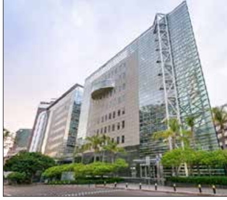
مبنى BLOM الرئيسي

لا شك في أن التطورات التقنية والتكنولوجية المعاصرة التي ساهمت إلى حد كبير في تحديث القطاع المصرفي أتاحت المجال أمام العابثين لمحاولة خرق بعض الأنظمة المصرفية. وهذه هي الحال مع أي تطور جديد تستفيد منه شريحة من المجتمع وتحاول شريحة أخرى خرقه. إنما نلاحظ أن القطاع المصرفي واع لمحاولات الخرق والعبث، وقد وضع تدابير احتياطية ووقائية. ويحرص مصرفنا من خلال مركز خدمة الزبائن على العمل على مدار الساعة لتأمين أقصى درجات الراحة والأمان لعملائه ومراقبة العمليات التي تجري على حساباته ونفاذي أي عملية احتيال محتملة. إضافة إلى ذلك، يتخذ المصرف تدابير احتياطية عدة وأعلى وأحدث مستويات الأمان في الأنظمة التكنولوجية المستعملة على أجهزة الصراف الآلي للحد من محاولات العبث بهذه الأجهزة.