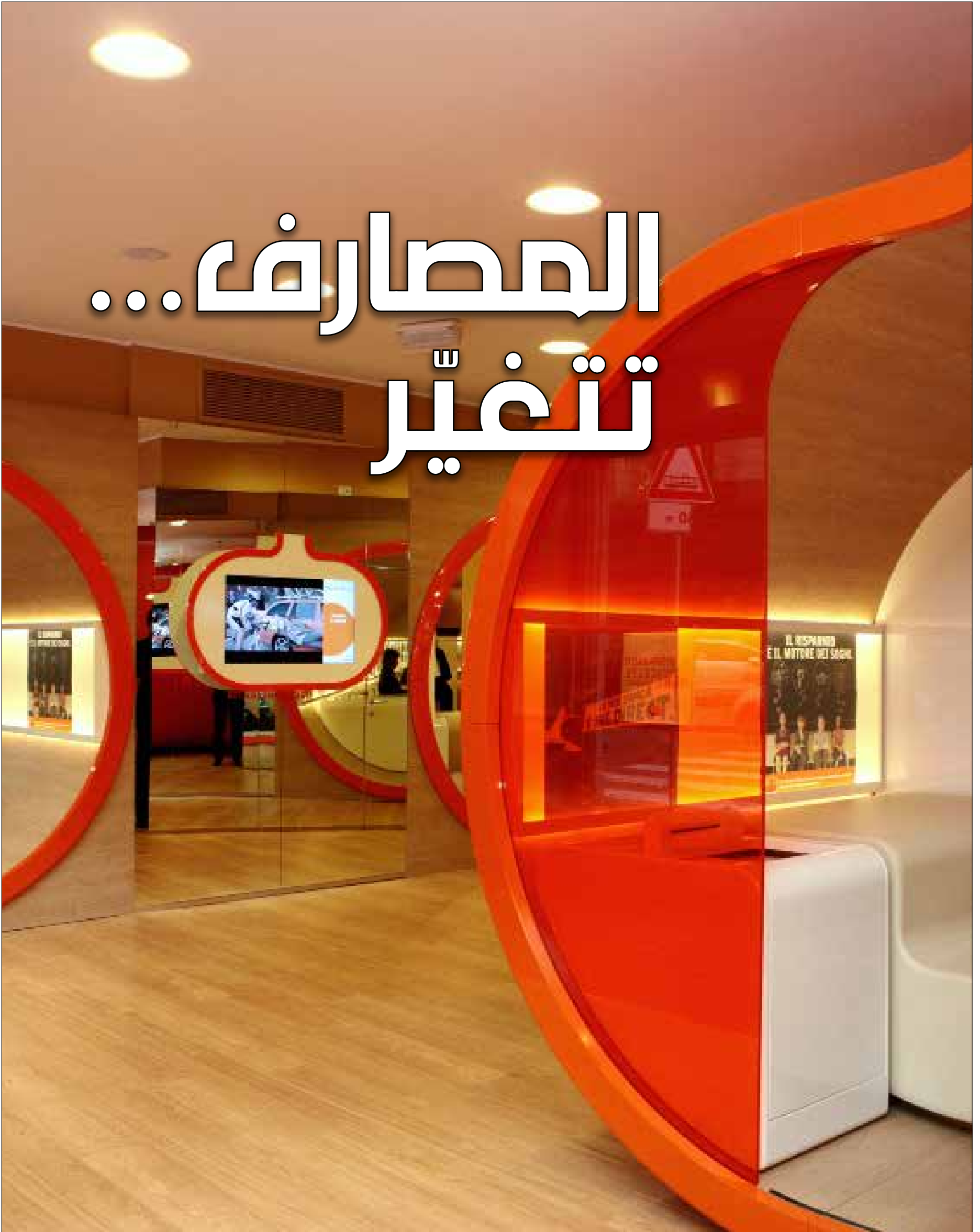
من داخل احد البنوك في مدينة ميلان الإيطالية