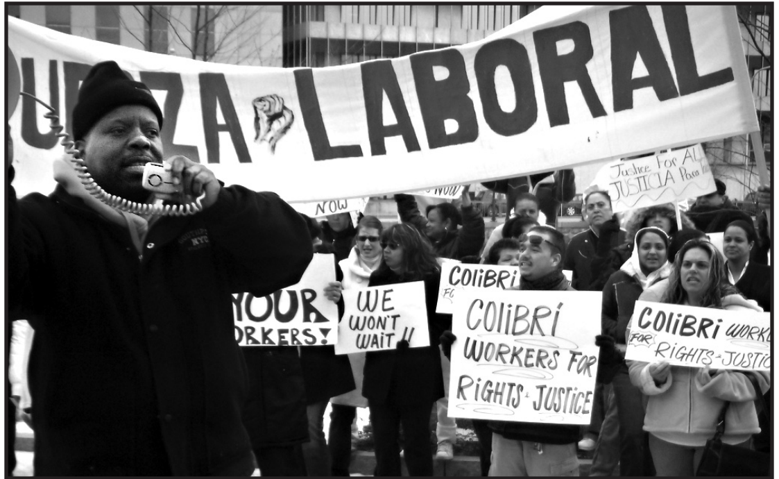
Colibri Workers for Rights and Justice

No es este fracaso el resultado de la avaricia de unos cuantos pocos? ¡Claro que no! Es el sistema economico, el ciclo de subida y