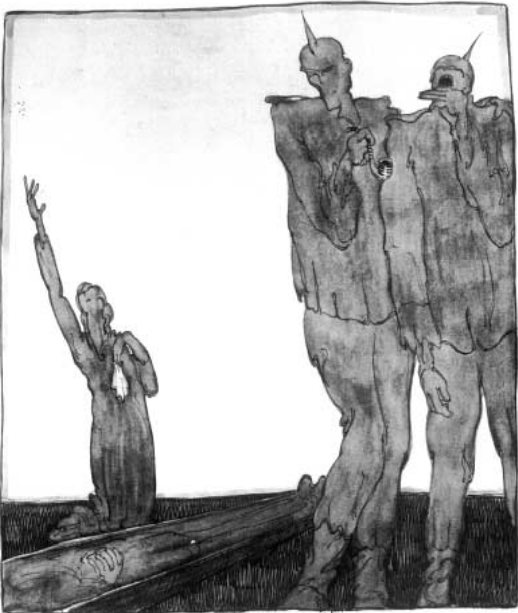
Escena alusiva a la guerra de 1914-18 Tinta gris verdosa sobre papel reutilizado, 37,4 x 31 cm. Hacia 1915-18

Más que ser artista, en estos momentos altamente humanos, importa ser grano de arena que se sume al simoun que todo lo barrerá