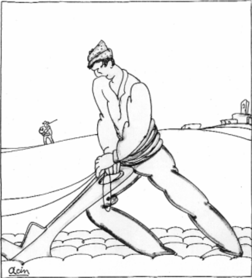
Dibujo destinado a las páginas de «Floreal» (1919-20) Tinta negra y acuarela sobre papel reutilizado 25,2 x 19 cm.