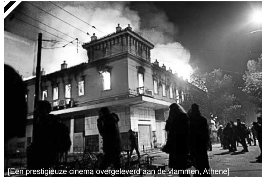
[Een prestigieuze cinema overgeleverd aan de vlammen, Athene]

Ver van ons om de vakbonden ervan te beschuldigen dat ze de basis "verraden" hebben. Ze vervullen gewoon